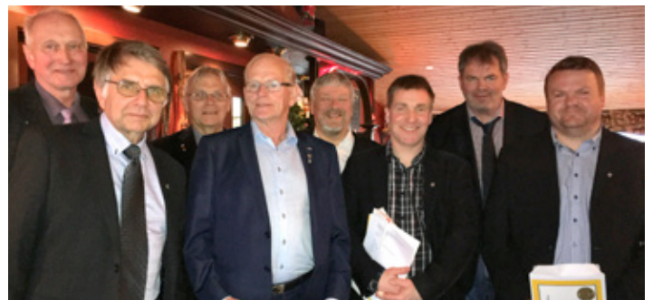
Nýjir félagar teknir inn á stjórnarskiptafundi.