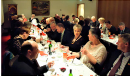
Jólafundur með Lkl. Skagafjarðar.