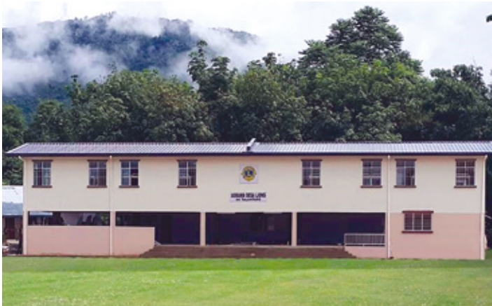
Nýja heimavistin hefur breytt lífi nemendanna svo um munar.

Áð komast til SK Talantangskóla í Sabah héraði í Malasíu, kostaði allt að fjögurra klukkustunda göngu innan um gríðarlega há gúmmitré í drullusvaði og yfir vota hrísgrjóna akra. Þessir nemendur búa á svæðum þar sem ekki eru neindir vegir og oftar en ekki voru þau berfætt. Stjórnvöld útvega þeim skó en þau vilja ekki eyðileggja skóna í svona göngu.