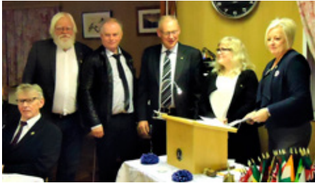
Formenn í Skagafirði og umdæmissjóri á súpufundi.