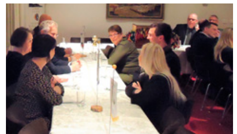
Lokafundur hjá Lkl. Höfða.