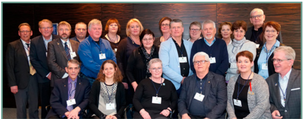
Nemendur í leiðtogaskólanum ásamt kennurum.