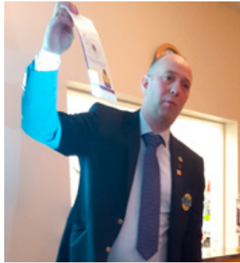
Björn varaumdæmisstjóri kom í heimsókn og messaði yfir lýðnum.