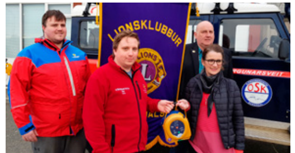
Mynd af afhendingu Lkl. Bdl. til björgunarsveitarinnar Ósk en við gáfum 2 hjartastuðtæki í bílana þeirra.