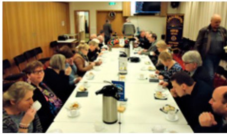
Bjarkirnar í heimsókn.