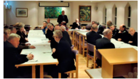
Í heimsókn hjá Lkl. Dalvíkur.