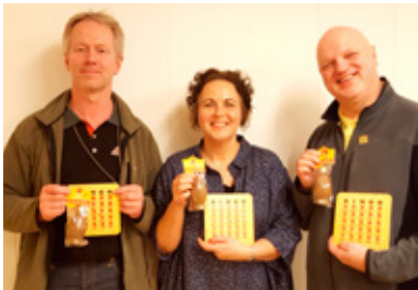
Þáskafundur – spilað bingó.