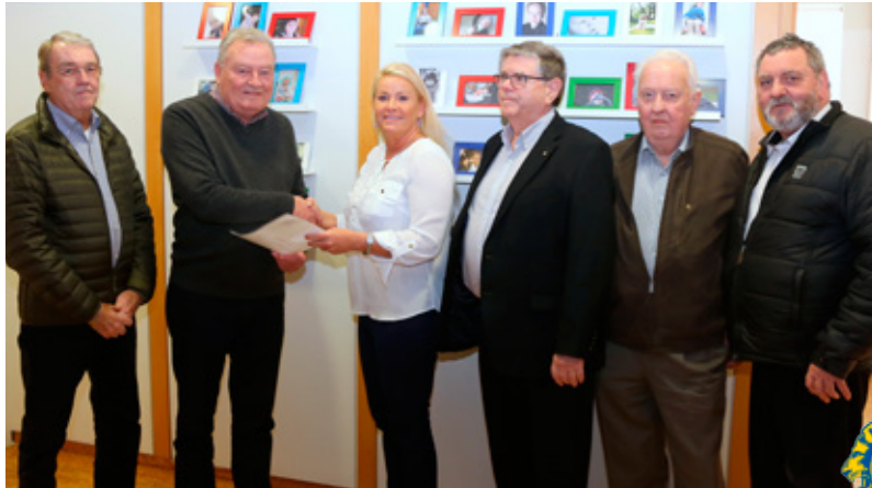
Nokkrir félagar klúbbsins ásamt Bárnu.