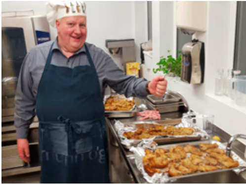
Kótilettur eldaðar að hætti Jóns í Sauðhúsum.