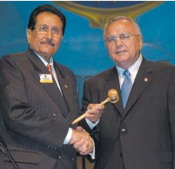
Viðtakandi og fráfarandi alþjóðaforsetar.