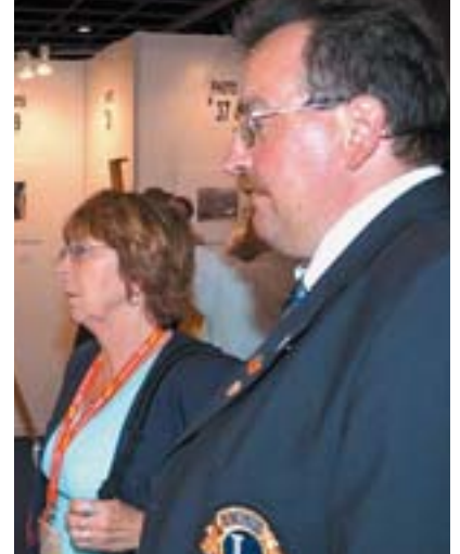
Þessi mynd birtist á heimasíðu hreyfingarinnar. Af Oddnýju og Valdimar umdæmisstjóra.