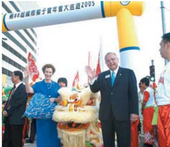
Fráfarandi forseti og frú veifa mannföldanum.