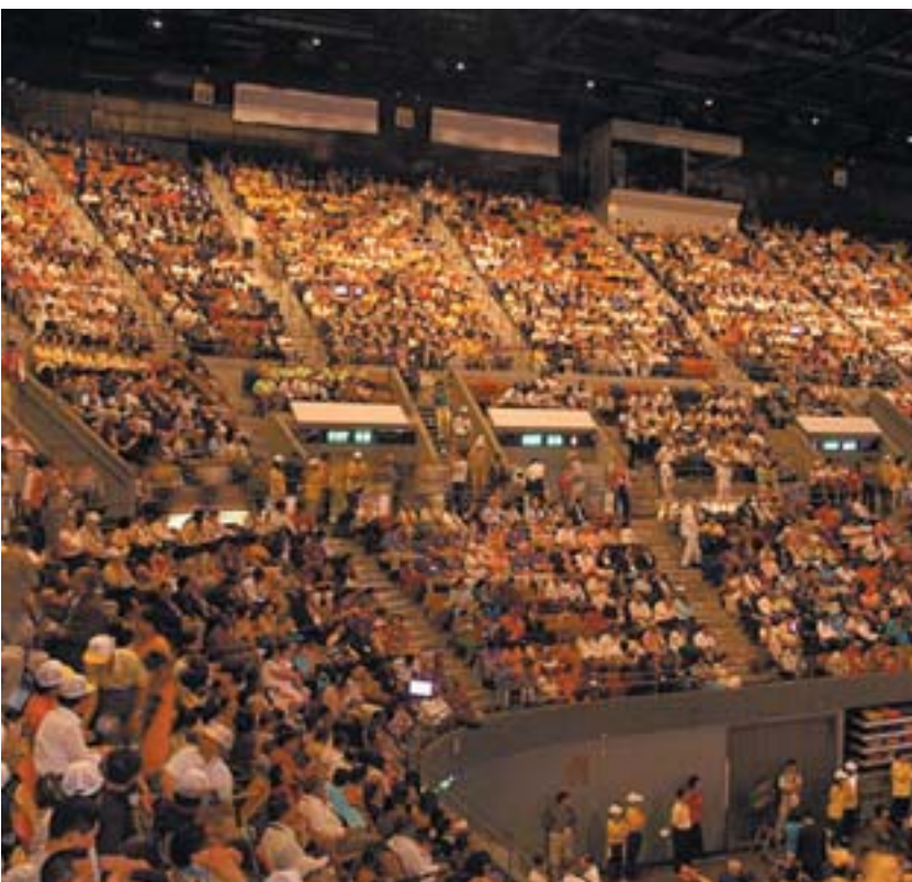
Þingfulltrúar á alþjóðþingi. Um það bil 2200 Lionsfélagar og fjölskyldur þeirra sóttu þingið.