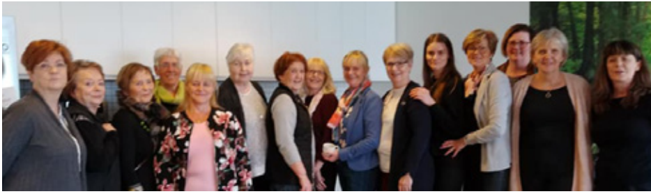
Gjafir afhentar til Hugarafis