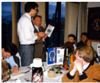
Fundur í maí 1990 í Lionsheimilinu Sóltúni.

Í ár fagna félagar í Lionsklúbbum Fjörgyn 30 ára starfsafmæli klúbbsins. Fjörgyn var stofnaður 14. maí 1990. Fyrsta starfsárið funduðu félagar í Lionsheimilinu í Sóltúni 20. Síðar fluttust fundir í sal í Hverafold 1-3 í eigu Sjálfstæðisflokksins í Grafarvogi.