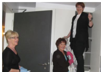
Prif til fjárfummar