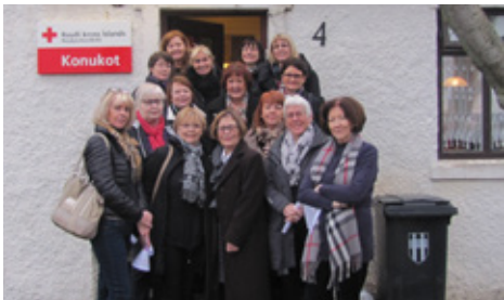
Lionskonur í heimsókn í Konukoti 6. febrúar 2014