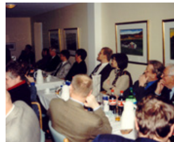
Hluti gesta við formlega opnun Lionssalarins.

Á haustmánuðum 1997 var Lionssalurinn tekinn formlega í notkun. Nærri 70 manns sátu hátíðarkvöldverð á þeim tíma-mótum. Umdæmisstjórar, ritstjóri LION, félagar úr Fjörgyn, Fold og Mosfellsbæ svo eitthvað sé nefnt.