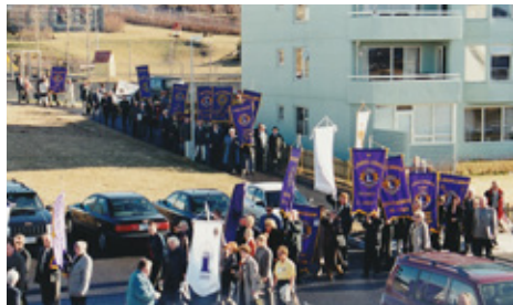
Skrúðganga á 50 ára afmæli Lions á Íslandi