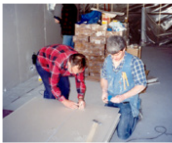
Búið að einangra og setja plastfilnu. Verið að klæða vegg með gísploötum.

Þegar bygging Grafarvogskirkju stóð yfir komu klúbbfélagar að mörgum verkum. Fyrsti hluti kirkjunnar var tekin í notkun um áramótin 1993/1994. Á árunum 1995-1997 innréttuðu félagar í Fjörgyn Lionssalinn á annari hæð Grafarvogskirkju. Salurinn hefur auk funda klúbbsins verið nýttur fyrir fermingarfræðslu og ýmsa fundi er tengdust starfi í kirkjunni.