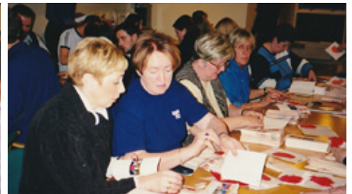
Rauð fjöður undirbúin