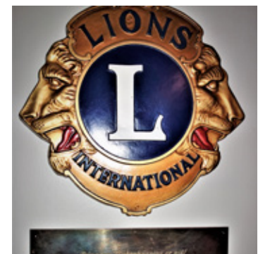
Lionsmerki og skjöldur vegna stórgjafar LCIF 1974 til opunar Sjúkrahússins

Stefnt er að því í haust að aðstaða fyrir augnlækna af fullkominni gerð verði starfrækt innan HSU í Vestmannaeyjum og verður augnlæknastofan búin öllum nýjasta og fullkomnasta tækjabúnaði, sem völ er á í dag. Búnaðurinn er: augnsjá með ljósgjafa Haag Streit – OCT tæki sem er augnbotnamyndavél/ sneiðmyndavél til greiningar og rannsóknar á sjónhimnukvillum og gláku, auk hrörnunarsjúkdómum í augnbotnum. – Tölvustýrður sjónmælir/sjónsviðsmælir til nákvæms mats á sjónsviði og öðrum meinsemdum sem hafa áhrif á sjónsvið – Smátæki og fylgihlutir s.s augnskoðunarstóll, augnspeglar, tölvubúnaður og samskiptalausnir við aðgerðastofu í Reykjavík. Það er alþjóða hjálparsjóður Lions hreyfingarinnar ( Lions Clubs International Foundation, LCFI) sem stendur að baki kaupunum ásamt fjölda bakhjarla. Áætlaður kostnaður við tækin og fylgihluti verða um 24 milljónir króna en helmingur upphæðarinnar kemur frá alþjóða hjálparsjóðnum og verður búnaðurinn afhentur í nafni LCIF sjóðsins. Við umsókn til hjálparsjóðsins leitaði Lionsklúbbur