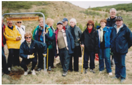
Foldarreiturinn í byrjun