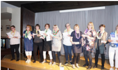
Vorferð í Stykkishólmu