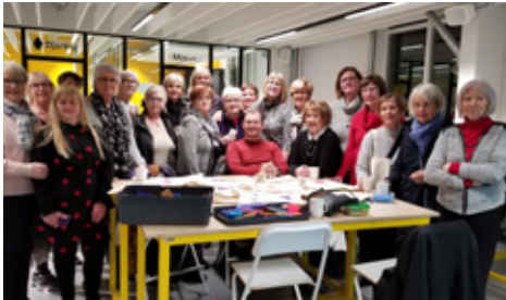
Í heimsókn í Tækniskólanum