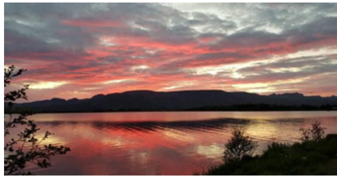
Sólarlag við Apavatn

Þann 29.08. tóku fjórar Úur þátt í umdæmis og fjölumdæmisráðsfundi í Hlégarði, mjög gagnlegur fundur og margt spennandi í gangi.