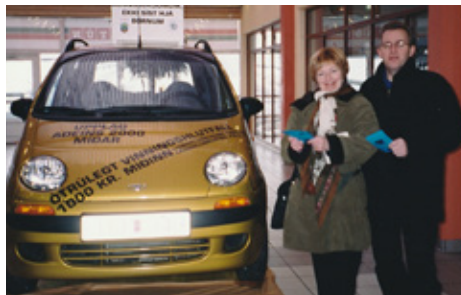
Bílahappdrætti á 10 ára afmæli Foldar og Fjörgynjar