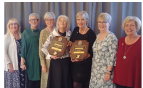
Hátíðarfundur á 30 ára afmæli

land að Syðri Grunnvötnum í Heiðmörk í fóstur og þar hafa félagar plantað greni, furu og birki í gegnum árin í samstarfi við Skógræktarfélag Reykjavíkur svo nú er svæðið orðið að fallegum trjálundi þar sem áður var aðeins lágvaxinn villtur gróður.