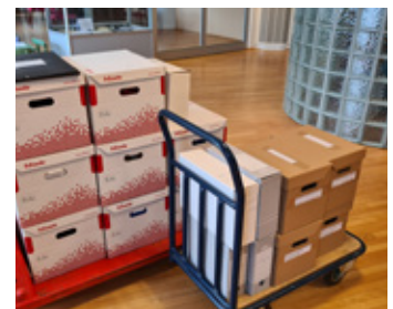
Skjalasafni Fjörgynjar afhent Borgarskjalasafni