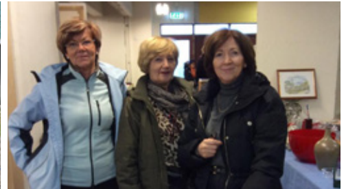
Kolaportíð vinsælt til að afla fjár