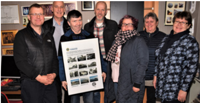
Fjárflyunarnefnd L.V. ásamt stjórn kvenfélagsins Líknar sem komu með 5 milljónir króna inn í verkefnið