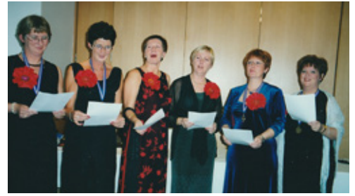
Í 10 ára afmælisferð til Pragh