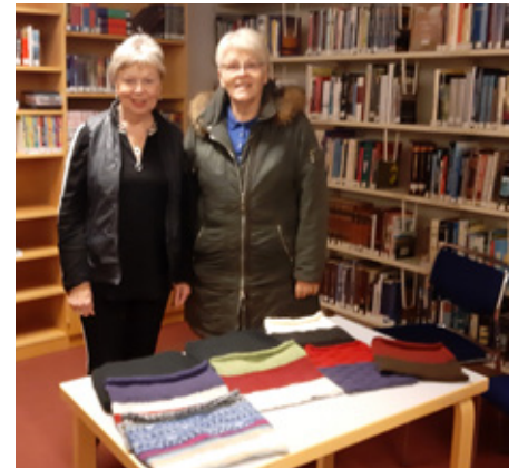
Til hjálpar pokadýrunum í Ástralíu

Starfið hjá okkur í Lkl Seylu var mótað af veirufárinu, eins og hjá öðrum klúbbum. Við urðum að fella niður fund í apríl og sömuleiðis vorferðina.