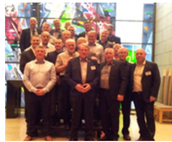
Félagar eftir tónleika