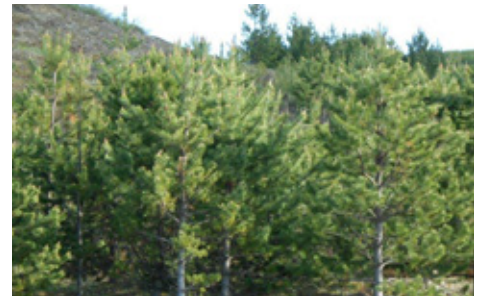
Foldarreiturinn 20 árum síðar