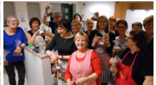
Smákökur bakaðar til gjafa