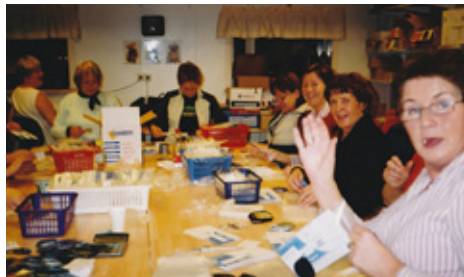
Pakkað fyrir Hjálparstofnun kirkjunnar