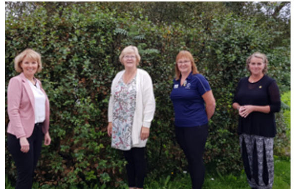
Að loknum fyrsta fundi fjölumdæmisstjórnar í Hlégarði 29. ágúst 2020

bæjar klúbbnum en þess utan mættu 3 Úur ásamt mökum. Á laugardeginum var farið í árlegt golfmót þeirra, sem flestir taka þátt í en færstir kunna. Eftir góða útiveru voru grillaðar samlokur og er gaman frá því að segja að hvortveggja er gert til heiðurs fyrrum félögum þeirra. Skemmtileg og falleg minning.