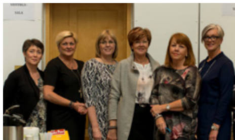
Veitingasala á tónleikum