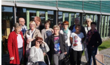
Í Þýskalandi á 25 ára afmælinu