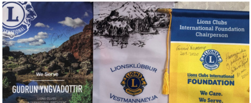
Fánar tengdir verkefninu