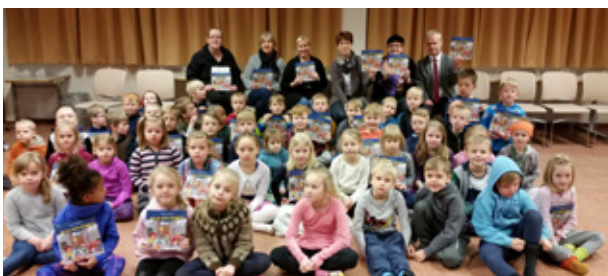
Rimaskóla gefnar bækur