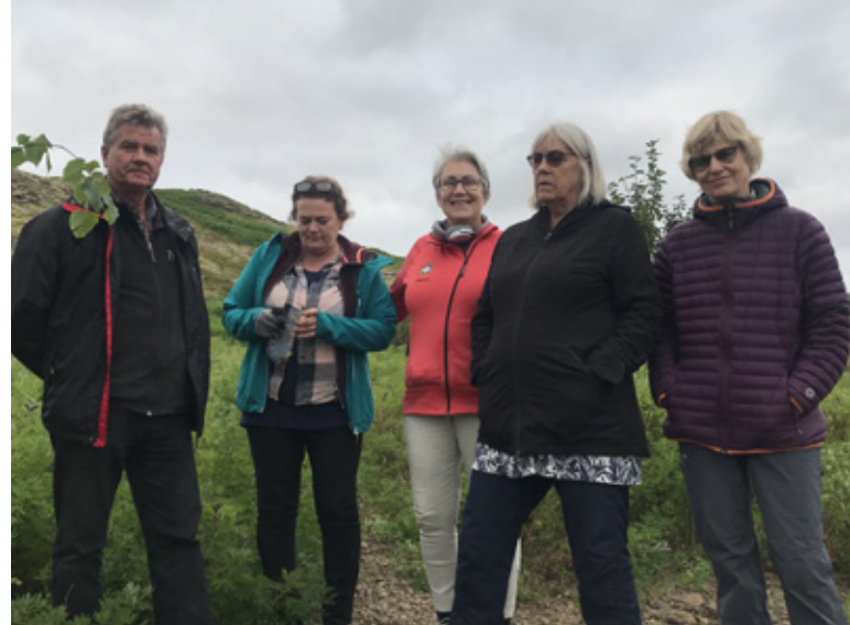
Hópurinn sem tók þátt í verkefninu