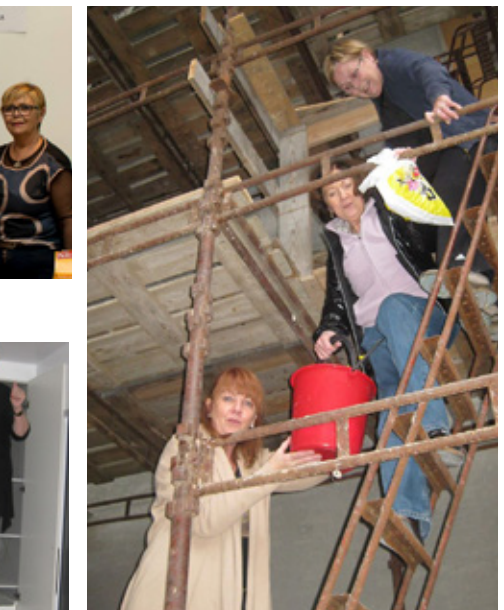
Ýmislegt lagt á sig til að afla fjár