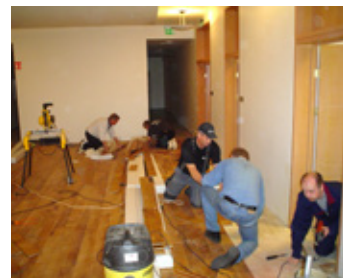
Parkettlöggi í kjallara Grafarvogskirkju.

Félagar í Fjörgyn hafa greitt fyrir húsaleigu með því að vinna mörg stór og smá verk fyrir Grafarvogskirkju gegnum árin. Lagt parket og flísar, skipt um hundruðir ljósapera, slípað og olíuborið parkett.