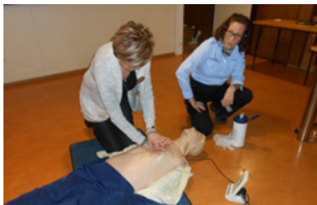
Foldarkonur á skyndihjálparnámskeiði um borð í slysavarnarskóla sjómanna