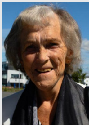
dugnaður og áhugi Hlífar dvínaði ekki þó að aldur færðist yfir. Hún