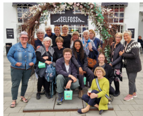
Unglingaskipti – hópurinn ásamt Emblufélögum