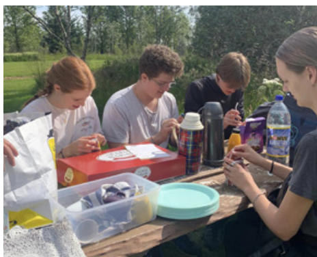
Unglingaskipti móttaka – „Bröns“