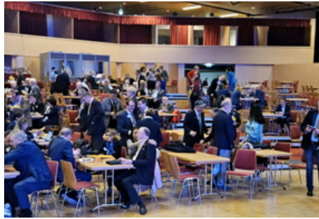
Séð yfir hluta salarinnssinn.

Það var vel staðið að öllum málum á þinginu, hvort sem um var að ræða fundi, kynningar á málefnum og/eða skemmtunum á kvöldin. Á svona þingum eru að sjálfsögðu kosningar um hinar ýmsu lagabreytingar og aðrar breytingar. Á þessu þingi voru 13 liðir sem þurfti að kjósa um og var undirrituð fulltrúi Íslands og sú eina sem hafði kosningarétt fyrir það. Það eru ýmsar serimoníur í gangi og til dæmis er ein af þeim að fjölumdæmisstjóri má hafa með sér einn ráðgjafa sér til halds og trausts. Yfirleitt er þetta fyrirverandi alþjóðastjórnarmaður sem aðstoðar þar sem þeir hafa