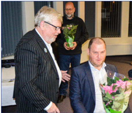
Formanni Lkl. Vestmannaeyja Bergvini færð blóm.