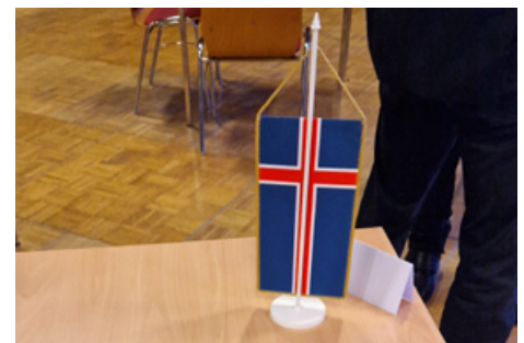
Kosningar að hefjast