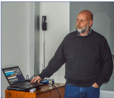
Jón Þór Birgisson