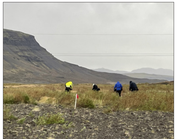
Dynksfélagar planta birki í Þjórsárdal.

Starfsárið hefur verið annasamt og fjölbreytt hjá Lkl Dynk, Skeiða- og Gnúpverjahreppi. Á meðal verkefna klúbbsins eru plöntun birkis í Þjórsárdal. Þar fékk Dynkur svæði úthlutað á vikrunum skammt frá Hjálparfossi og er plantað árlega yfir 10.000 plöntum. Um er að ræða kolefnisjöfnun sem fólk og fyrirtæki geta stutt við.