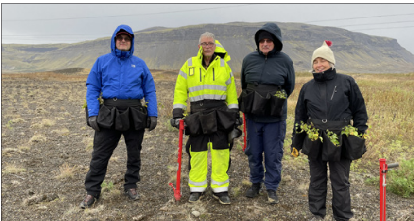
Dynksfélagar planta birki í Þjórsárdal.