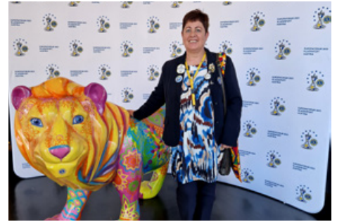
Fjölumdæmisstjóri við ljónið í inngangi ráðstefnuhallarinnarsinn.