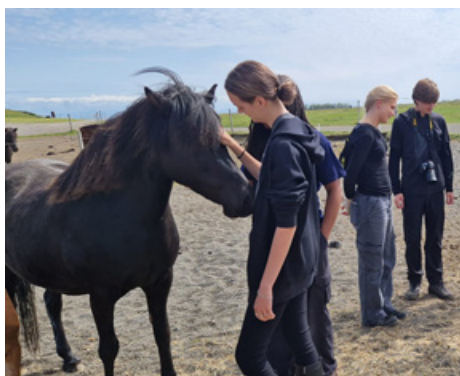
Unglingaskipti – heimsókn á hestabúgarð