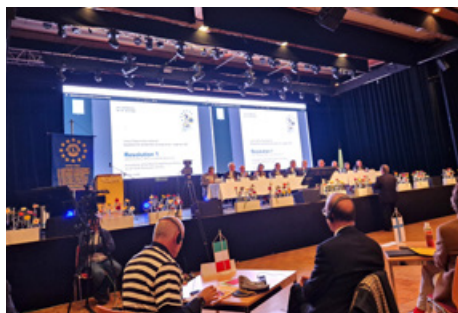
Séð yfir sviðið þar sem að stjórnendur þingsins og alþjóðastjórnarmenn sátu og sáu um að allt færi eftir lögum og reglum