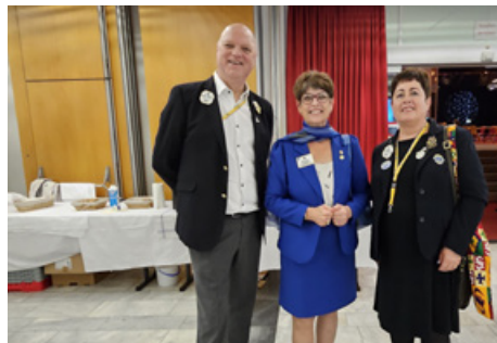
Við hjónin ásamt alþjóðaforseta Patti Hill