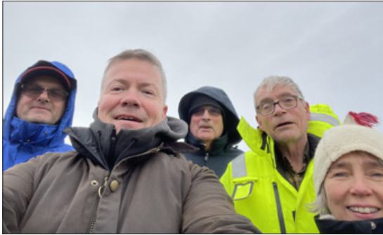
Dynksfélagar planta birki í Þjórsárdal.