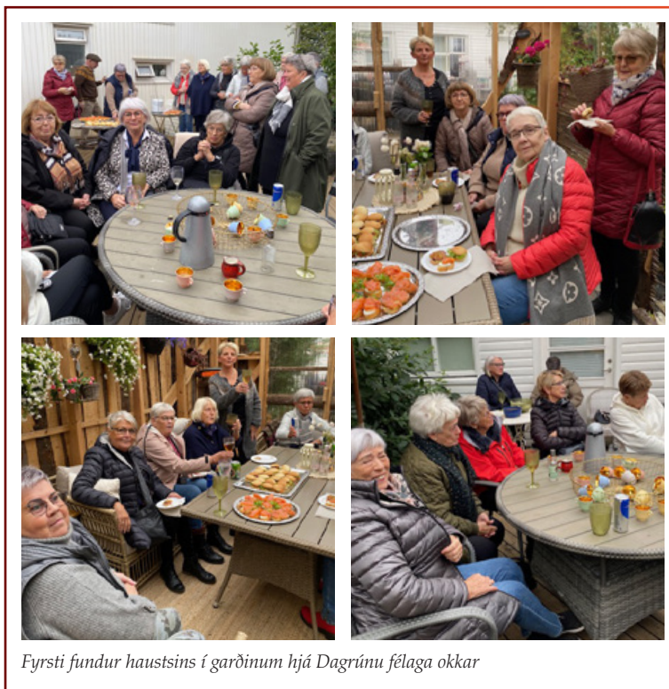
Fyrsti fundur haustsins í garðinum hjá Dagrúnu féлага okkar