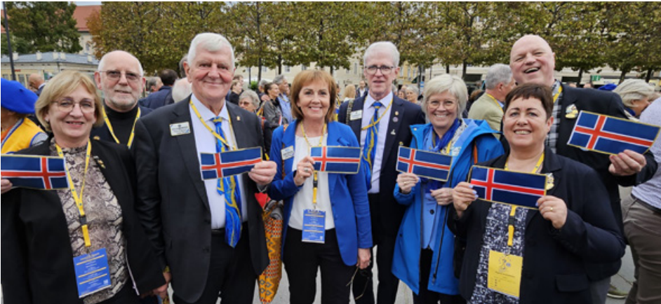
Íslendingarnir með íslensku fánana sína í skrudgöngunni.