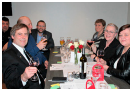
Afmælishátíð með mökum.