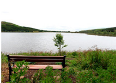
Áningabekkurinn góði við Hvaleyrarvatn.