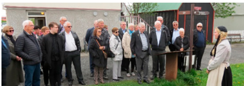
Vorferð í Árbæjarsafni.