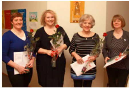
Fjórir nýjrir félagar.

Góður hópur úr Seylu tók þátt í 100 ára afmælisferð með nágrennasklúbbum okkar á svæði 6 og fengum við frábærar móttökur í blíðskaparveðri í Hafnarfirði, Garðabæ og Álftanesi og dagurinn var bæði fróðlegur og skemmtilegur í alla staði. Lokafundur Seylu var haldinn laugar-