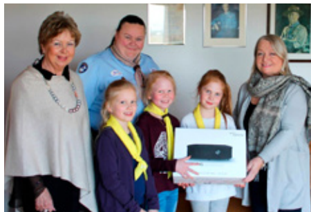
Afhending skjávarpa til Skátafélagsins Svanir.