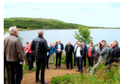
Lions- og Skógræktarfolk á góðri stundu.