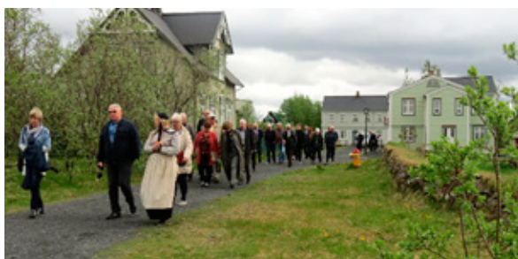
Á göngu um Árbæjarsafni.