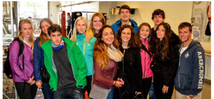
Nokkur úr hópnum að sjóða egg í Hveragarðinum í Hveragerði.