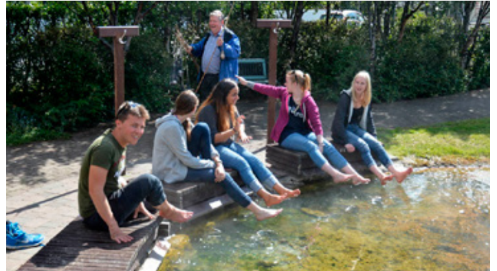
Nokkur úr hópnum að bleyta í tám í Hveragarðinum í Hveragerði.