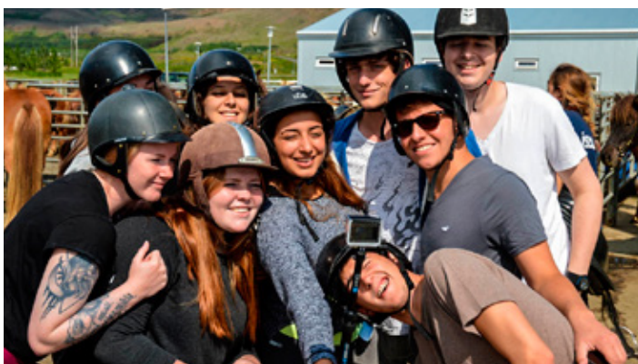
Hópurinn fékk að fara á hestbak hjá Eldhestum.