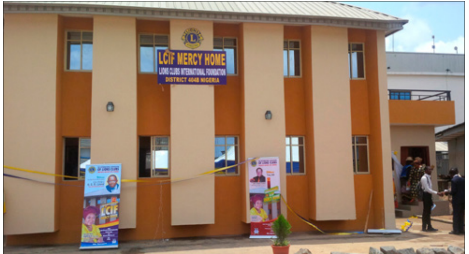
Sjúkrahótelið er gríðastaður krabbameinssjúklinga sem þurfa gístaðstöðu meðan á meðferð stendur.

Með 75.000 dollara Standard Grant framlagi LCIF og mótframlagi Lionsfélaga í