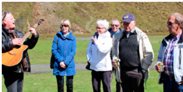
Spilað og sungið í Pakgili.