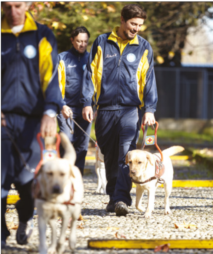
Leiðsöguhundar þjálfaðir á Ítalíu.

Lionshreyfingin á Ítalíu hefur þjálfað leiðsöguhunda fyrir blinda síðan 1959 og ráðstafað yfir tvö þúsund hundum. Framtíð þessa verkefnis var tryggð fyrir skömmu þegar Lions opnaði nýja aðstöðu fyrir þjálfun leiðsöguhunda í Limbiate, í nágrenni Mílanó.