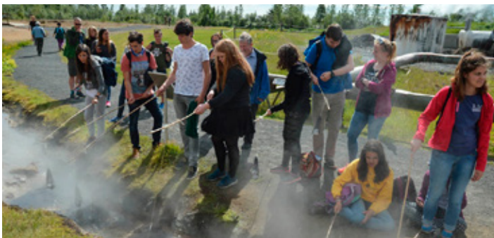
Hópurinn heimsótti Kjörís og hér eru þau í frystigeymslunni.