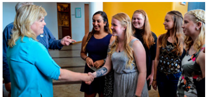
Aldís bæjarstjóri heilsaði upp á ungmennin á lokavöldi þeirra hér.