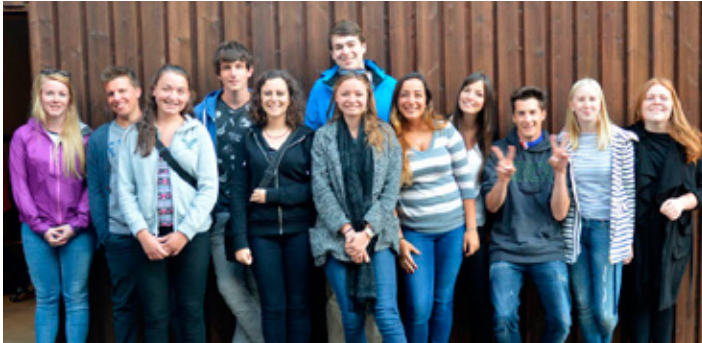
Hópurinn við komuna í grunnskólann í Hveragerði en þar dvöldu þau.