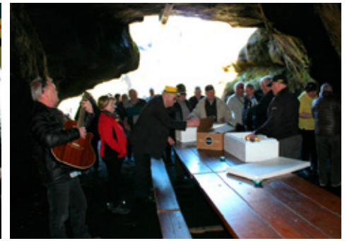
Nesti snætt í Hellisskúta í Pakgili.