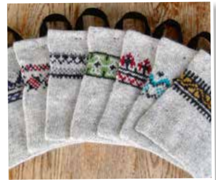
Fyrsta fjáröflunarverkefnið- lopatöskur.