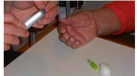
og hér blóðsykur