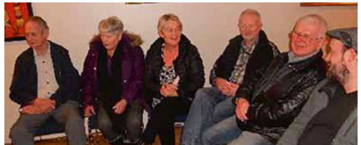
Biðröð eftir mælingu