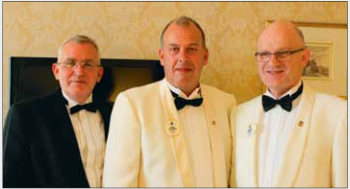
Fjölumðæmisstjóri ásamt umdæmisstjórum.