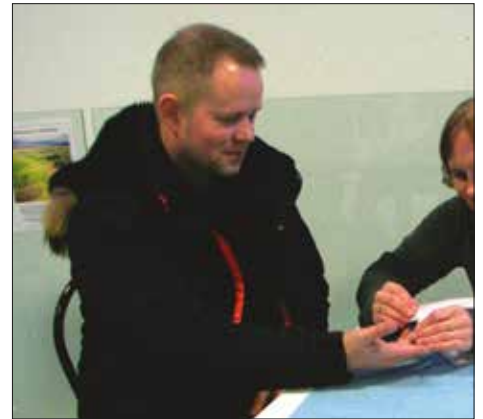
Myndir teknar í Miðjunni á Hellu.