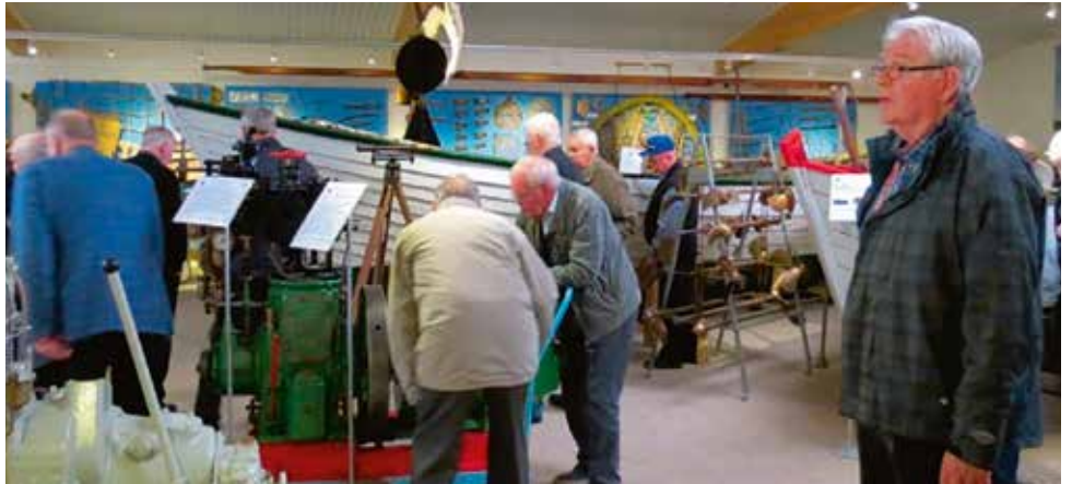
Byggðarsafnið við Garðskagavita skoðað.