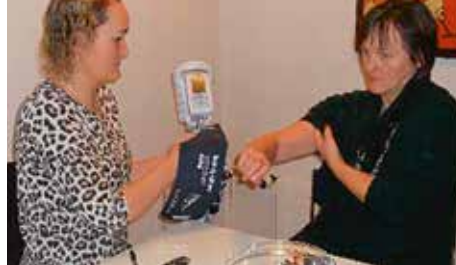
Hér skal mældur blóðþrýstingur