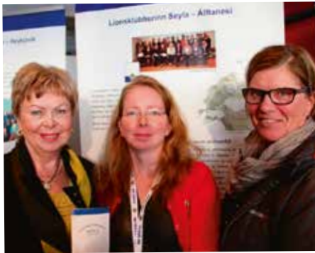
Við rúllustandinn í Ráðhúsinu á WSD daginn.