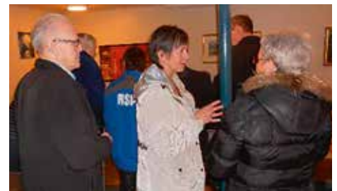
Skeggrætt um niðurstöður

Svo er stefnt á mælingu í Mývatnssveit og Þingeyjarsveit eftir áramótin, Lionsklúbbur Húsavíkur er með mælingu frá Þórshöfn í austri að Vaðlaheiði í vestri, en mælir annað hvert ár austan og vestan Húsavíkur en á Húsavík á hverju ári. Takk fyrir í ár og gleðileg jól