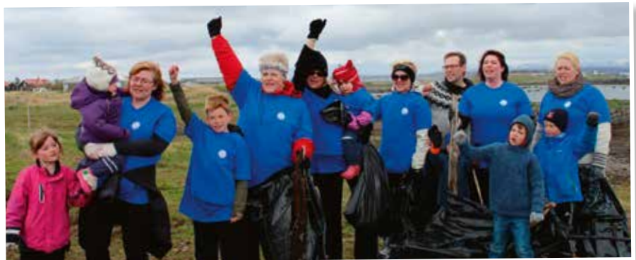
Seylukonur við fjöruhreinsun á Álftanesi.