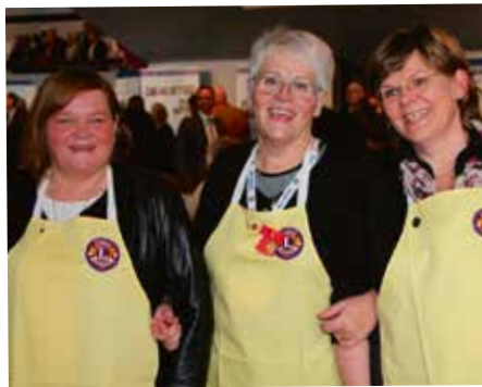
Seylukonur sáu um kaffihúsið í Ráðhúsinu.