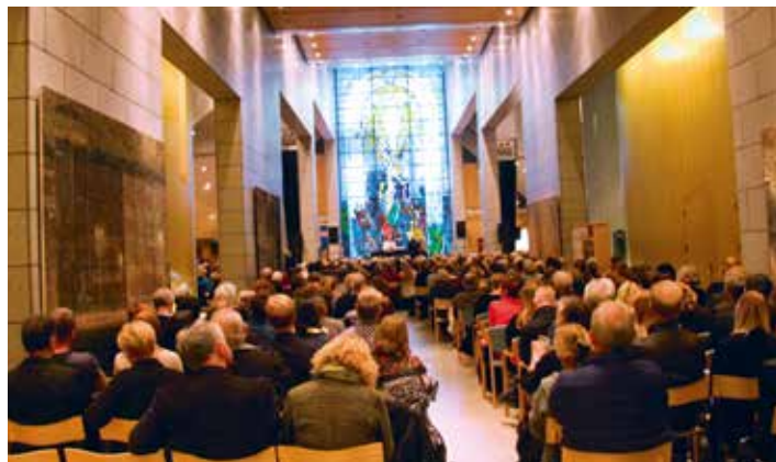
Kirkjan var þéttsetin gestum og komust færri að en vildu.

Eitt skemmtilegasta árlega verkefnið hjá Fjörgyn síðustu tólf árin eru styrktartónleikar fyrir BUGL og líknarsjóð klúbbsins. Húsfyllir hefur verið öll árin (nema eitt).