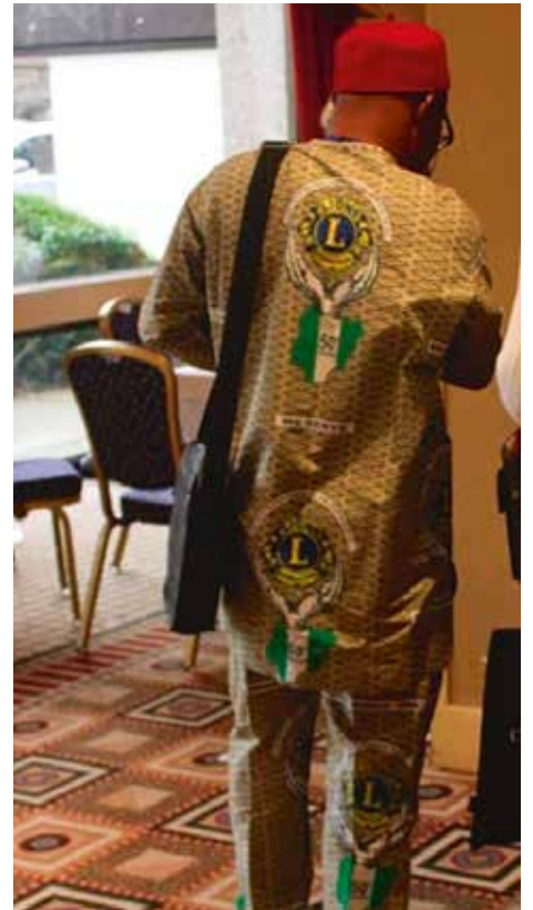
Sumir eru flottari en aðrir!

Eins og alltaf þegar við stöndum í svona verkefni eins og ungmennaskipti eru þá þurfum við á hjálp Lionsfélaga að halda. Lionsfélaga sem tilbúnir eru í að opna heimili sín fyrir þessum ungmennum og bjóða þeim að dvelja hjá sér í eina viku fyrir ungmennabúðirnar. Því miður hefur það verið frekar erfitt að leysa þetta verkefni en von mín er sú