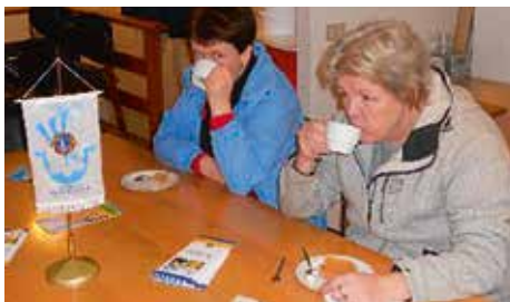
Kaffi og vöflur á eftir