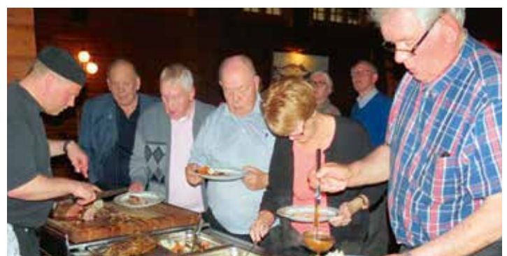
Við veisluborðið í Skíðaskálanum.