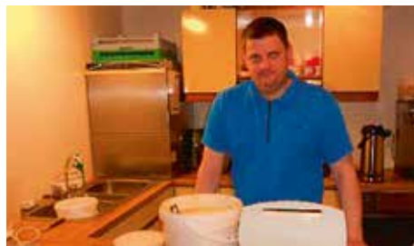
Logi kokkur í vöflu bakstri