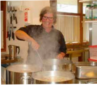
Súpa elduð á fjölmæmisfundum.