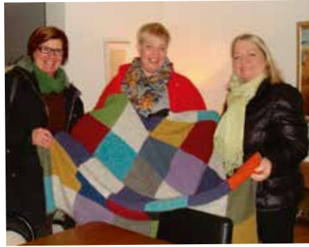
Konukoti afhent lopateppi.