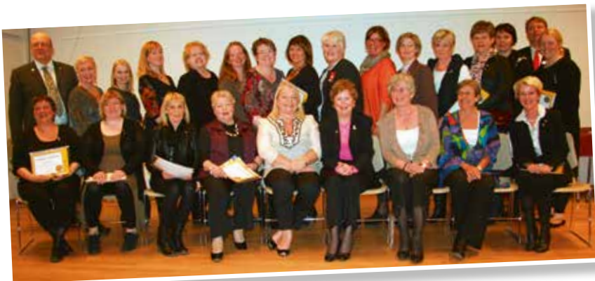
Stofnfundur Seylu, 1. mars 2012.