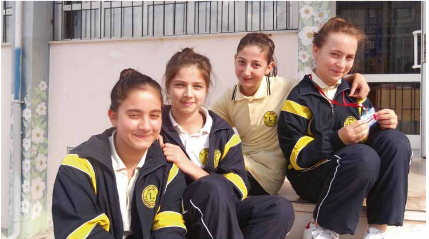
Lions Quest kennir börnum í Tyrklandi hvornig er best að takast á við erfiðleika með jákvæðu hugarfari.

Nemendur vítt og breytt um heiminn verða fyrir einelti og miklum þrýstingi frá jafnöldrum sínum. Þetta hefur áhrif á heilsu þeirra, velferð og ekki síður námsárangur. Í Tyrklandi er þetta verulega mikið vandamál vegna skólakerfis sem gerir mjög háar kröfur og litlir möguleikar eru á öðrum námstækifærum.