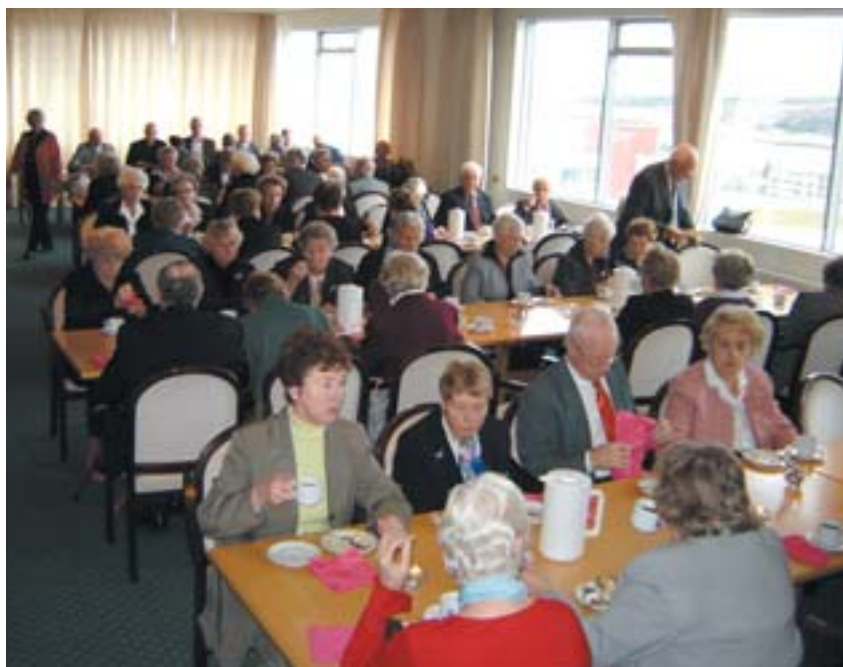
Veitinga notið að lokinni kirkjuferð.

Að messu lokinni var öllum hópnum ekið í Kópavog aftur og í Lionsheimilið Lund Auðbrekku 25 - 27 en þar tóku á móti hópnum félagar úr Lkl. Ýr með kaffihlaðborð eins og þeim einum er lagið. Eftir að allir höfðu gert kaffihlaðborðinu góðs skil og ræður fluttar þá óku félagar úr Lkl. Munin öllum til síns heima.