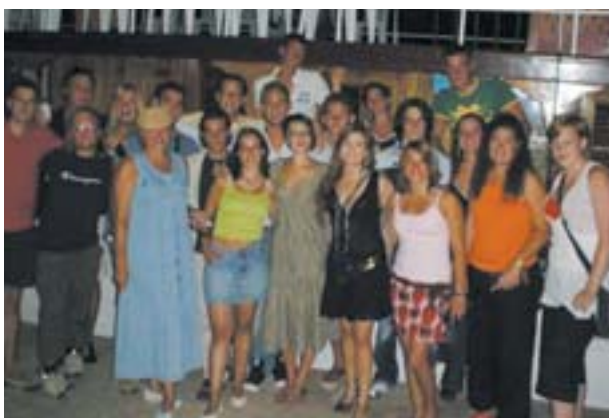
Allur hópurinn fyrir utan bátinn.