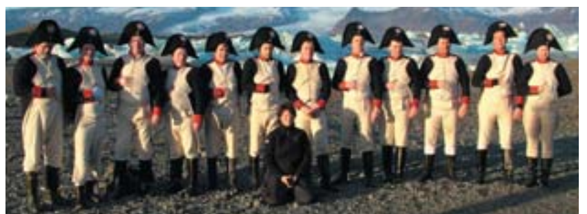
Lionsmenn og fleiri í ríki Vatnajökuls

Vaskur hópur fór til starfans og heyrnt hef ég að ekki hafi þeim leiðst þær æfingar. Skálað var síðan í Napoleonskonjaki að loknum vinnudegi. Þó kalsamt væri á köflum, þótti félögunum verkefnið glaðlegt og fjárhagslegur ábati varð nokkur af verkefninu. Biða menn spenntir við símann eftir næsta verkefni.