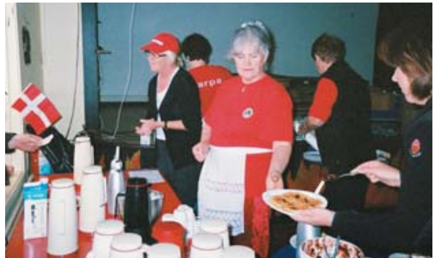
Danskir dagar, vaskar Lionskonur.