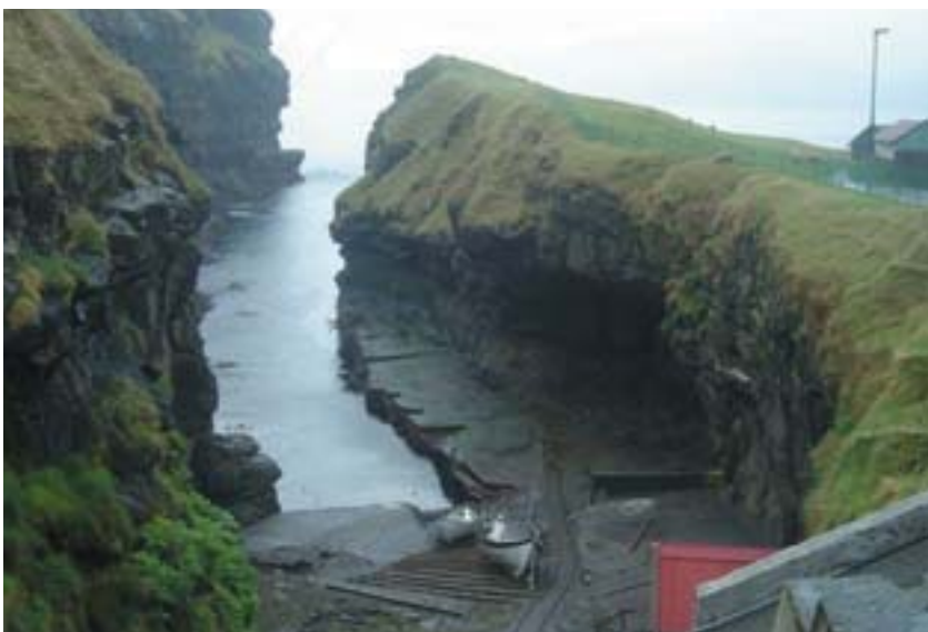
Bátalægi í einum bænum í Færeyjum.