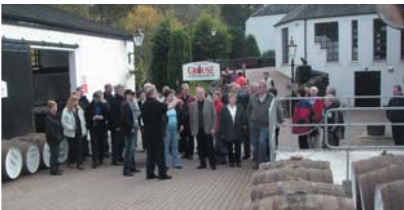
Lionsfélagar við viskiverksmiðju í Edinborg

að umdæmisþingi í vor. Því miður gátu ekki allir félagarnir farið og lágu til þess ýmsar ástæður. Alls fóru þessa ferð 15 félagar ásamt mökum, samtals 30 manns. Ferðin tókst mjög vel að mati þeirra sem í hana fóru. Sá er þennan pistil skrifar átti þess ekki kost að heimsækja Skotland að þessu sinni, en af viðtölum við þá sem fóru má ráða að ferðin hafi náð tilætluðum árangri. Allir komu sælir og glaðir til baka og hafa margt að segja um menningu og listir úr hinni fornfrægu borg Edinborg. Tilganginum var náð. Að ferðast saman, eins og að vinna saman, hvort heldur er málningarvinna, girðingarvinna, eða annað, skapar samkennd sem okkur er nauðsynleg til að efla félagsstarfið í nútíð og framtíð.