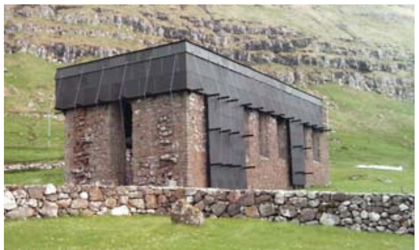
Gamla kirkjan í Kirkjubæ í Færeyjum.

haldinn var smá hátíðarkvöldverður og svo lá leiðin heim á sunnudeginum.