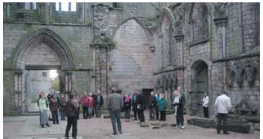
Lionsfélagar skoða kirkjurústir í Edinborg

hús og selja perur og ekki hentar öllum að fara í málningargalla og mála bílastæði og ekki ráða allir við járnkarlinn í girðingarvinnunni. En það er nauðsynlegt að félagarnir geri eitthvað saman annað en að mæta á fundum. Því ákvað stjórn klúbbsins okkar að efna til ferðar félaganna til Edinborgar í Skotlandi. Það var hugsað sem umbun fyrir vel heppn-