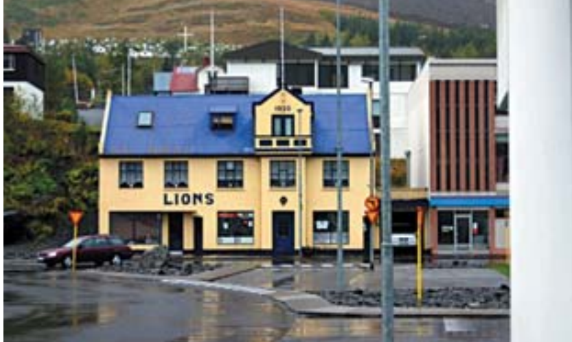
Lionshúsið á Siglufirði.