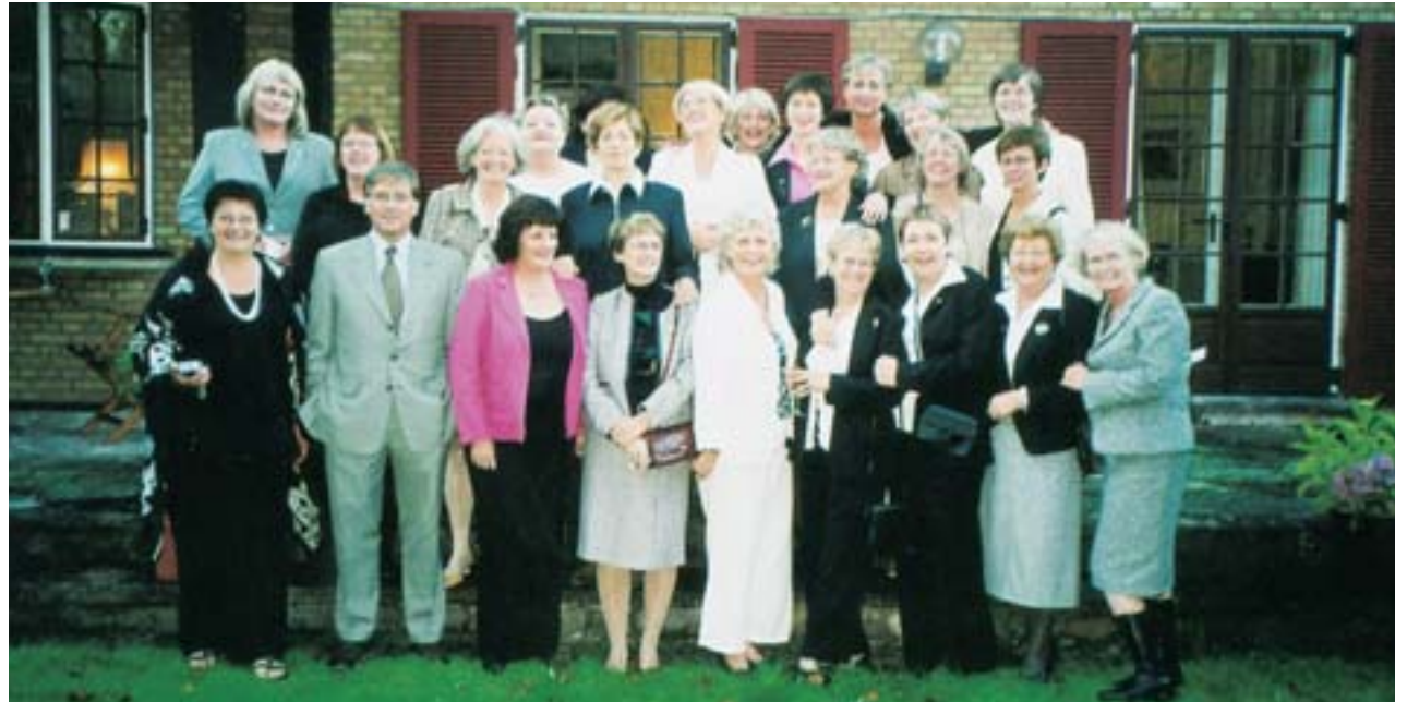
Í heimsókn hjá sendiherrahjónunum á heimili þeirra fyrir utan Kaupmannahöfn.

Í tilefni afmælisins var svo farið til Kaupmannahafnar í september. Ferð-