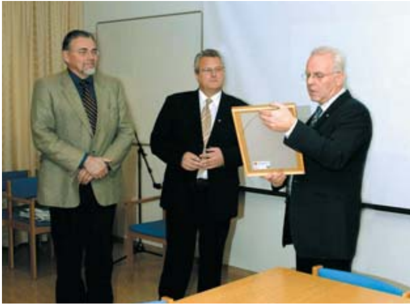
Svipmyndir frá afhendingu búnaðarins.