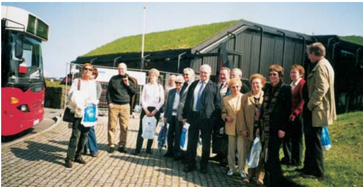
Hluti af ferðahópnum fyrir utan Norrænahúsið.

Um kvöldið fengum við sal til umráða á hótelinu og kl. 20.00 var lokafundur starfsársins settur að loknum kvöldverði og að viðstöddum eigin-konum. Eftir fundinn var slegið á