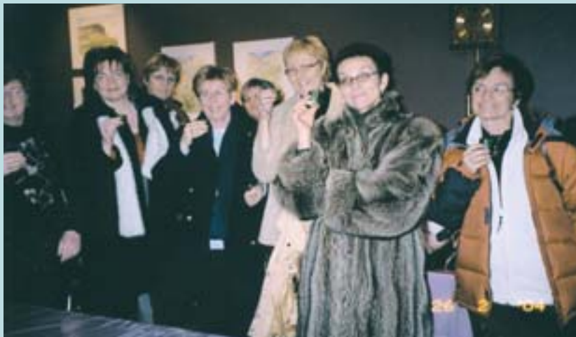
Eikarkonur með gúrkumjöld í niðurskornum gúrkum.

Í nýlegri ferð Lkl. Eikar út í bláinn var Hafíð bláa við Ölfusárósa fyrsti áfangastaður. Ferða- og útivistarnefnd lét ekkert uppi hvert ferðinni væri heitið og því getgátur á lofti alla leið austur yfir fjall. Á áfangastað beið rjúkandi sjávarréttarsúpa sem smakkaðist mjög vel. Fljótleg komu fleiri hópar til að gera henni skil en það fólk var komið til að skoða norðurljósin.