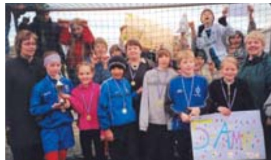
Lið 5. AMH í Hofstaðaskóla.

launapeninga og allir þátttakendur viðurkenningarskjal.