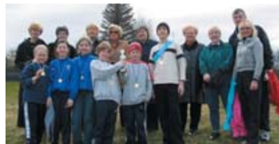
Lið 5. SG Flataaskóla.

Hlaupið var spennandi í báðum skólum og fór vel fram. Hlaupið var 6 x 100 m boðhlaup. Í Flataaskóla vann lið 5. SG og í Hofstaðaskóla var það lið 5. AMH sem vann. Vinningsliðin fengu bikara og verð-