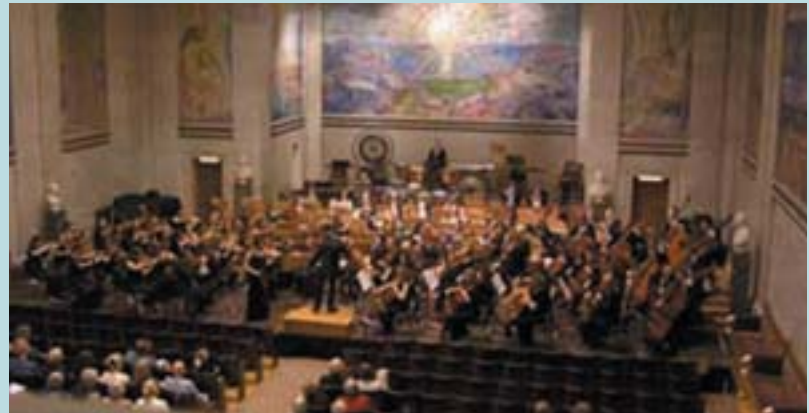
Tónleikar í Háskólanum í Osló.