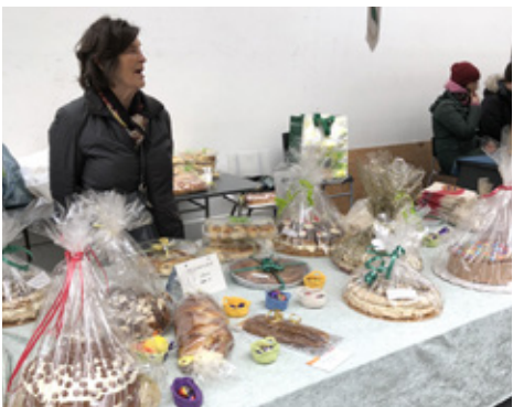
Handverks- og kökubasar í Mjóddinni.