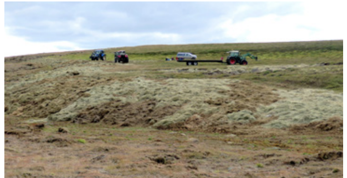
Hér hafa rofabörð verið jöfnuð út og sárið þakið með heyi.