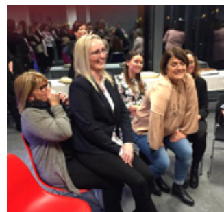
Samfundur í október- glens og grín