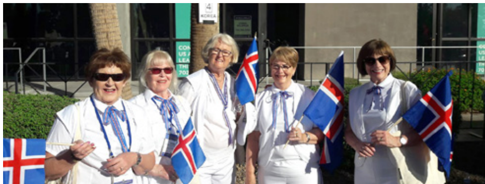
Foldarkonur á alþjóðþingi s.l. sumar.

Alveg frá stofnun hafa Fold og Fjörgyn starfað mikið saman að ýmsum verkefnum. Undanfarin 15 ár höfum við unnið með Fjörgynjarmönnum við tónleikahald í Grafarvogskirkju sem er ótrúlega skemmtilegt verkefni. Í vetur unnu klúbbarinn saman í þriðja sinn að blóðsykurmælingum í húsnæði Krónunnar á Bíldshöfðanum. Þar voru mældir 612 einstaklingar og létu mjög margir í ljós þakklæti sitt við Lions. Foldarkonur stóðu að