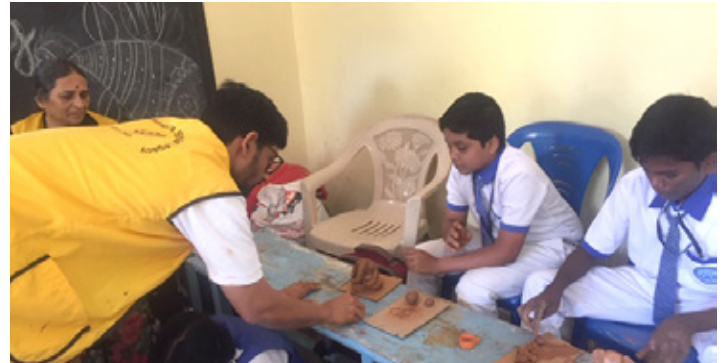
Leofélaginn Yashas kennir nemendum að búa til náttúruvænt Ganesha líkneski úr leir.