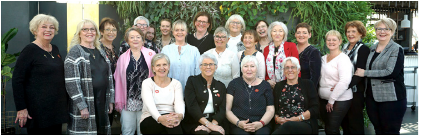
Vorferð í Perluna.

sjálfsögðu vaktina þegar Rauðu fjaðrar sófnunin stóð yfir og tókum þátt í Lestraráttaksverkefnum MD 109 sem að þessu sinni voru tvö, að dreifa bókamerkjum og heimsækja nokkra leikskóla til að færa þeim gjafir frá Menntamálastofnun.