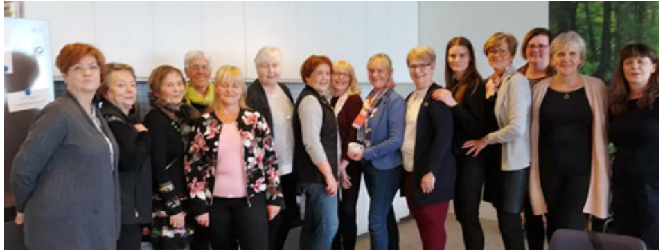
Í heimsókn hjá Hugarafli.