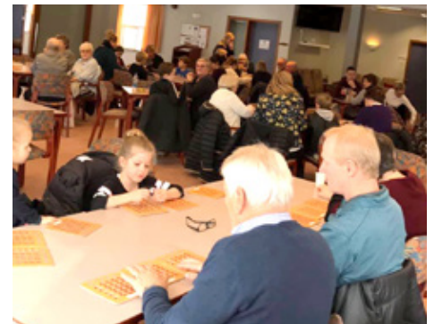
Kynslóðirnar skemmta sér við bingóspil.