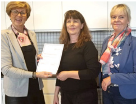
Hugarafli færð gjöf.