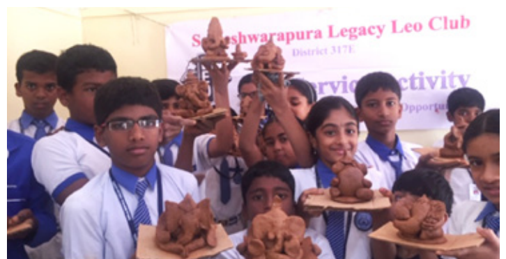
Stoltir nemendur sýna Ganesha líkneski sem þau hafa lagt mikla vinnu í að búa til úr leir.