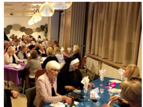
Gaman saman á dömkvöldi.