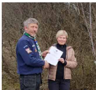
Afhending gjafabréfs Royal Rangers skátar

Eins og allir klúbbar erum við allan veturinn í fjáröflunum. Okkar helsta fjáröflun eru alls konar þrif, þrif á söfnum bæjarins, sumarhúsum og það sem til fellur. Einnig fórum við í vöru-