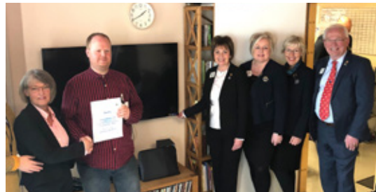
Forstöðulæknir Geðdeildar SAK Tekur við gjafabréfi frá Ikl. Ylfa á Akureyri.