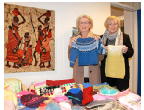
Hjálparstofnun kirkjunnar afhentur handprjónaður barnafatnaður.

Síðari hluta starfsársins hafa Engeyjarkonur haldið áfram af fullum krafti. Starfið í vetur hefur gengið vel. Þátttaka í verkefnum verið góð, fundir almennt verið vel sóttir og ýmislegt sér til gamans gert.