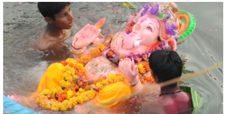
Hefðbundnu Ganesha líknesi sökkt í sjóinn.