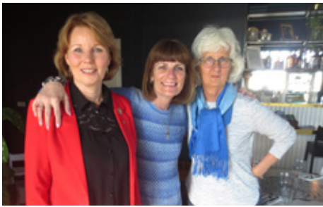
Stjórn næsta starfsárs