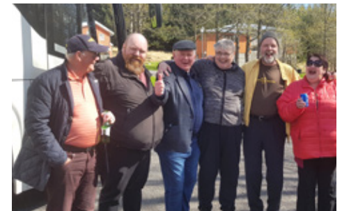
Nokkrir Ægisfélagar og vinir á Sólheimum í góðu skapi