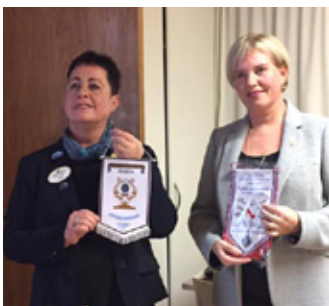
Sigfríð umdæmissjóri kom í heimsókn