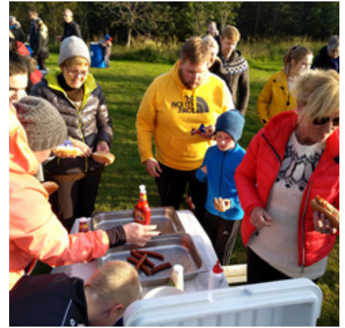
Fyrir fyrsta fund vetrarinnss budum við fjölskildum og vinum til leikja og grills á Ljónaflötinni í Hellisskógi

Starfið hófst með pylsugrilli fyrir félag, maka, börn og barnabörn á Ljónaflöt í Hellisskógi sem er rétt fyrir utan Selfoss og mættu þar um 60 manns, börn og fullorðnir. Ljónaflöt er svæði sem Lionsklúbbur Selfoss(Lks) hefur tekið í fóstur og hafa félagar plantað trjám, slegið gras, lagt göngustíga og nú síðast sett upp fánastöng. Hvet ég alla sem leið eiga um skógin að líta við. Fyrsti formlegi fundur var haldinn mánudaginn 17. sept í Eldhúsinu, Tryggvagötu en það er okkar fundarstaður. Við fundum fyrsta og þriðja mánudag fram í maí alls 16 fundi. Þessi fyrsti fundur var no 906 hjá Lionsklúbbi Selfoss.