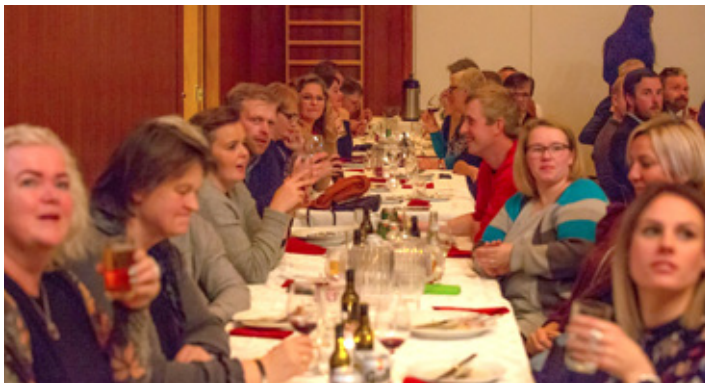
Fjöldmenni var á Snitselkvöldi Dynks í Árnesi.