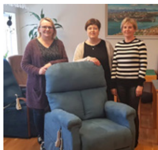
Afhending stóls til Dvalarheimilis