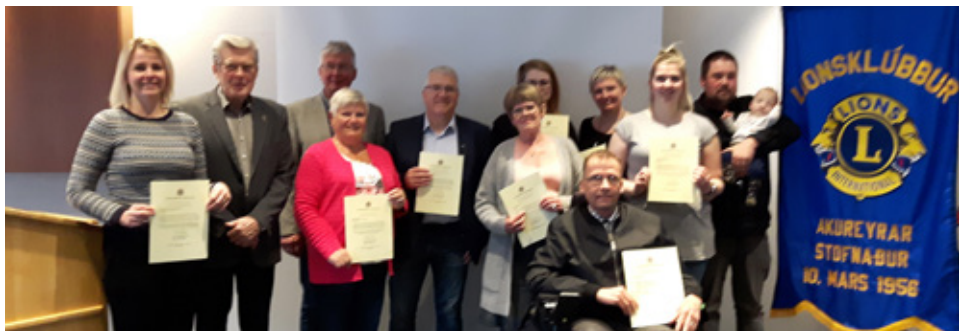
Lionsklúbbur aftendir styrki

hafði þrátt fyrir þann samdrátt úr töluverðu fé að ráða og 23. apríl voru tíu aðilum afhentir styrkir að upphæð kr. 2.020.000,00.