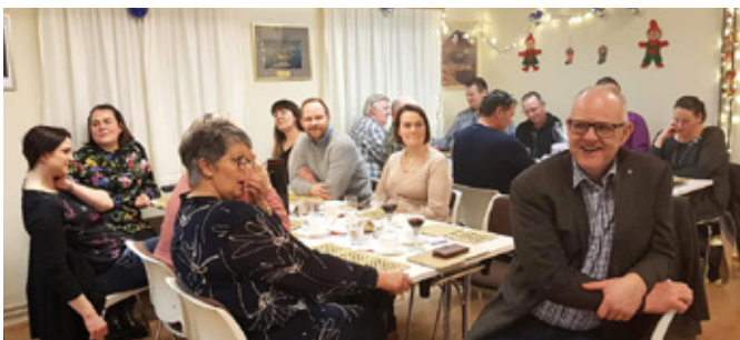
Bingó kvöld með Lionsklúbbi Stykkishólms