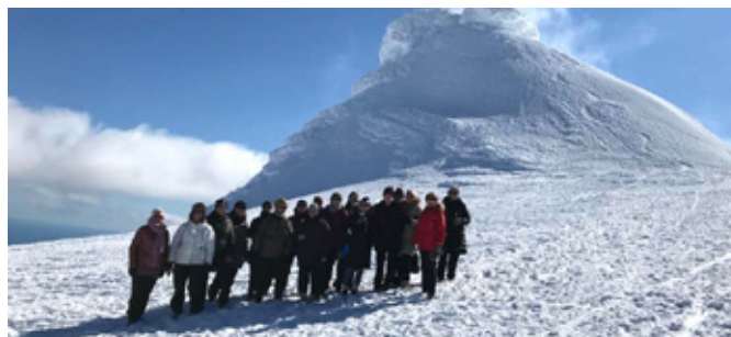
Lionskonur á Snæfellsjökli