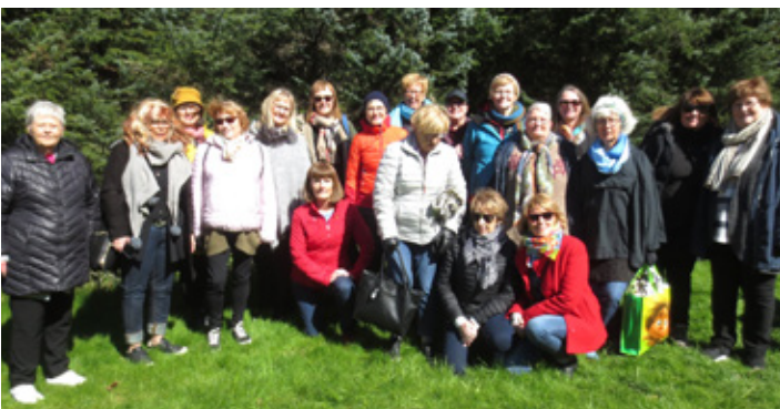
Í garðinum við Varmá