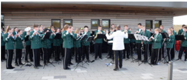
Skólahljómsveit Kópavogs. Unun var að hlusta á unglíngana spila