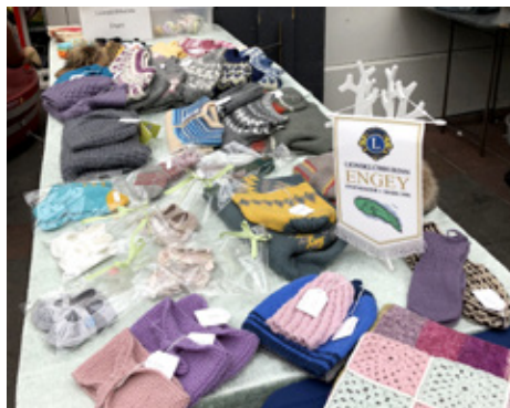
Handverk á basar.