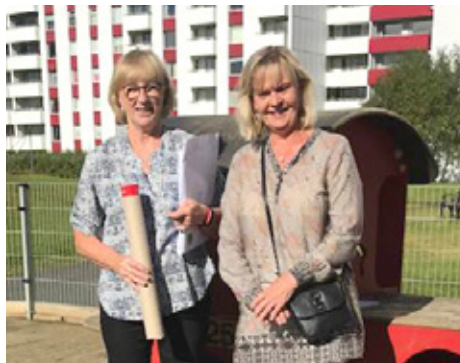
Arnáís formaður heimsækir leikskóla færandi gjafir.