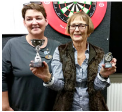
Pflukast meistari vorið 2018.