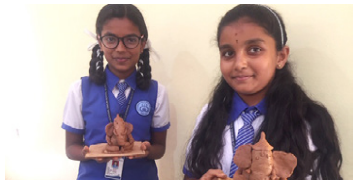
Tveir nemendur sýna sína útgáfu af umhverfisvænu Ganesha líkneski.