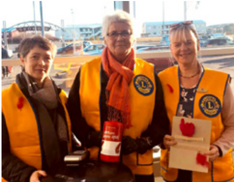
Foldarkonur standa vaktina.