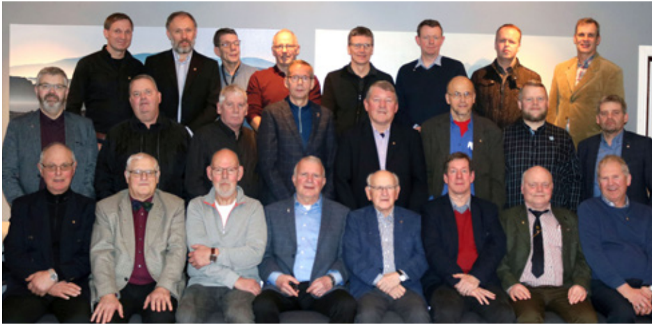
Hluti félagsmanna Lionsklúbbs Selfoss