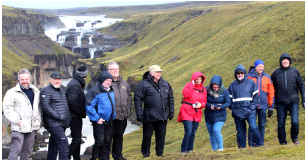
Fossinn Dynkur heimsóttur.