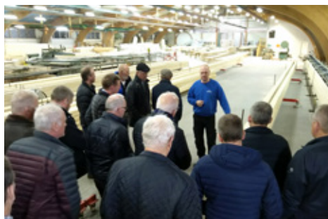
Heimsókn í Líntré á Flúðum