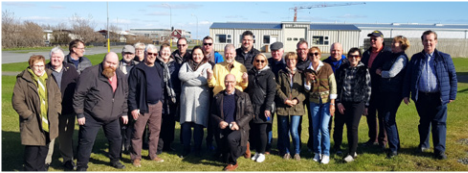
Lionsmenn og makar þeirra í frábæru veðri á Stokkseyri

Hefð er fyrir því að Lionsklúbburinn Ægir hljúki starfsárinu með því að skella sér í léttu vorferð með betri helmingum sínum. Að þessu sinni var hópurinn 25 manns og dugði þess vegna engin rúta heldur langferðabíll.