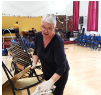
Þrif í Tónó - tuskan á lofti

talningar í Bónus 2x ári og síðan bókum við fyrir jól og páska. Samfélagið í kringum okkur nýtur góðs af og höfum við verið að gefa fyrirtækjum og stofnunum hér í Stykkishólmi pening eða hluti sem þeim vantar. T.d. fór ágóði síðasta kökubasars til Skátastarfsins Royal Rangers hér í Stykkishólmi og svo keyptum við rafknúinn hægindastól fyrir Sjúkrahúsið í Stykkishólmi. Fyrir vorum við búin