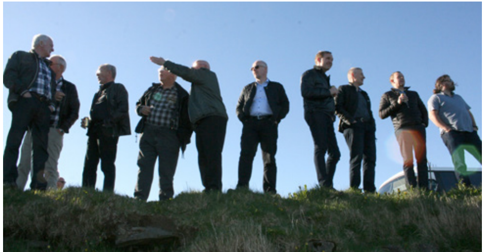
Félagar skeggræða á lokafundi

aulýsingum til að setja í blaðið og vil ég nota tækifærið og þakka þeim fjölmörgu fyrirtækjum og einstaklingum sem lögðu okkur lið í ár og hafa gert í mörg undanfarin ár, TAKK.