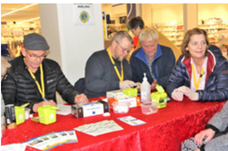
Blóðsykursmæling í Krónunni, samvinnu með Emblums

Jólablað Lks var borið í hús upp úr miðjum nóvember og er það okkar stærsta fjáröflun en það er í höndum blaðanefndar að setja saman blaðið. Við leitum til fyrirtækja um kaup á