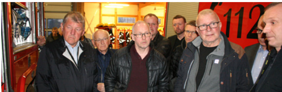
Klúbburinn í heimsókn hjá Brunavörnum Árnésinga