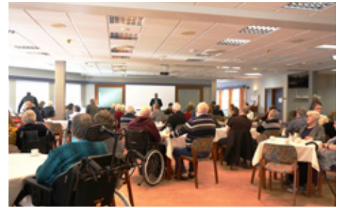
Heimsókn á Hjúkrunarheimilið Skógarbæ.