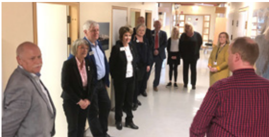
Forstöðulæknir Geðdeildar SAK fræðir Alþjóðaforseta Lionshreyfingarinnar og annað Lionsfólk um starfsemi deildarinnar á Akureyri.