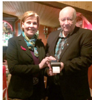
Ólína kaupir rauða fjöður af formanni Dynks.