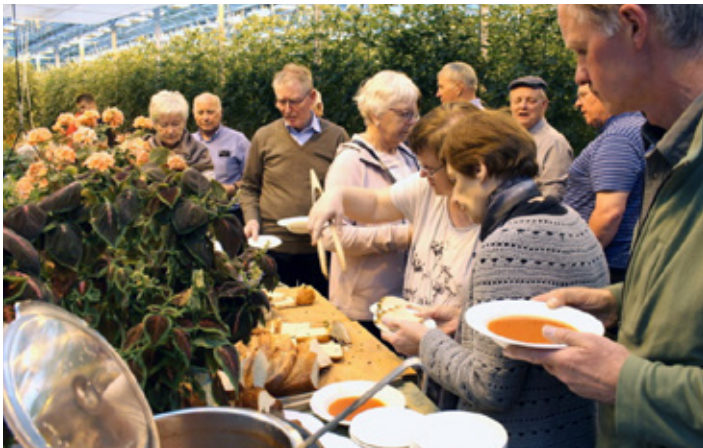
Í sumarferðinni var boðið var uppá kraftmikla súpu í Fríðheimum.