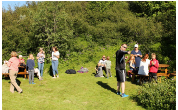
Lions- Lundurinn göði fyrir ofan Hafnarfjörð.