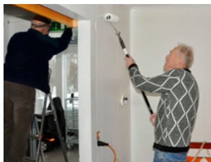
Frá vinnudegi í Reykjadal.