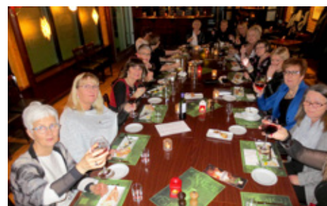
Á jólagleði Hlaðhömrum.