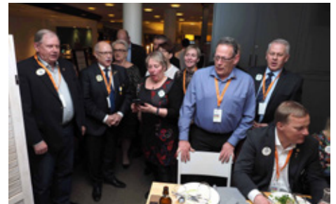
Íslenskur söngur á kynningarkvöldi.