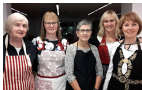
10 ára kátar Úur.