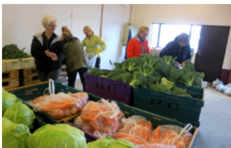
Brakandi ferskt grænmeti.

Með Lionskveðju Félaga- og fjölmiðlanefnd Úu