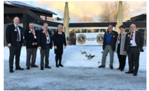
Íslenskir embættismenn á fundinum.

Kæru Lionsfélagar flest ykkar vita örugglega hvað NSR stendur fyrir en kannski ekki allir. NSR er skammstöfun fyrir Norræna samstarfsráðið sem stendur fyrir þinghaldi einu sinni á ári. Þingið er ávallt haldið þriðju helgina í janúar, til skiptis í löndunum fimm. Samstarf Norðurlandanna er mjög mikilvægur þáttur í starfi Lions og er því gert hátt undir höfði innan Lions International. Það er talið til mikillar fyrirmyndar og sýni hvernig samstarf milli landa innan Lions getur best verið. Norðurlöndin standa t.d. oft saman að tillögum á Evrópu þingum og ná betur fram sínum málum vegna samstöðunnar. Ég hef einnig orðið vitni að því að Alþjóðaforsetar hrósi þessari samstöðu og þeim góðu verkefnunum sem NSR hefur staðið fyrir, eins og t.d. þau sem við erum að vinna að núna næstu fjögur árin, sem er aðstoð á ýmsan hátt við flóttabörn frá Sírylandi, bæði í Tyrklandi og Líbanon.