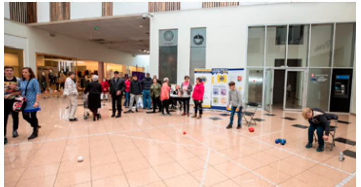
Bocciavöllur settur upp og fólki gefin kostur að spila.