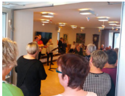
Söngur á Dalbæ.