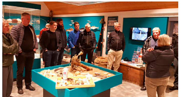
Þóra þakkar fyrir gjöfina og segir frá framkvæmdum.