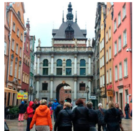
Gamlibærinn í Gdansk.