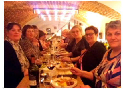
Afmælimatur 30 ára.