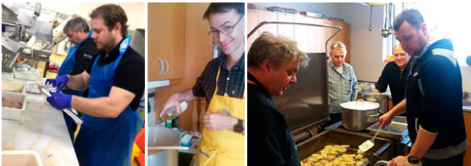
Myndir frá undirbúningi kúttmagakvölds.

Blaðafulltrúi Lionsklúbbs Grundarfjarðar.