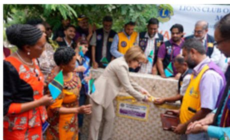
Drykkjarvatnskrannar á skólalóð í barnaskóla í Tanzaníu.