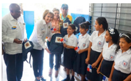
Skólatöskur fullar af bókum handa stúlkum í Panama; lestrarátaksverkefni.