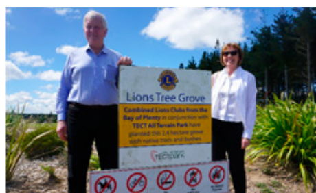
Lions skógur í Nýja Sjálandi, fallgett útivistarsvæði með gönguleiðum.