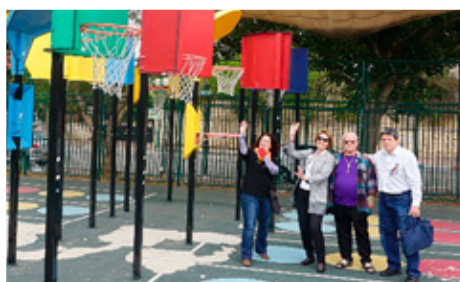
Leikvöllur eða æfingarsvæði fyrir fatlaða sem og ófatlaða í Ísrael.