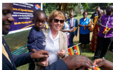
Lions í Úganda plöntuðu trjám í Lionsskógin. Öll fjölskyldan tók þátt (og börnin heilluðu ömmuna).