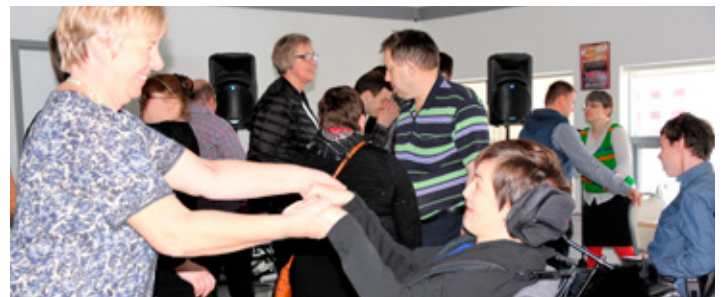
Dansað af hjartans list á Emblu diskóteki, þar er alltaf mikið fjör.