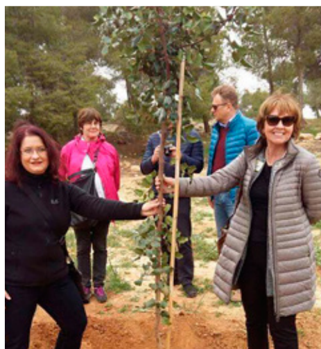
Trjáplöntun í Ísrael = aldarafmælis Lions-skógur. Erlendir Lionsgestir plöntuðu í skóginn, sem á að verða alþjóðlegur Lions-skógur.