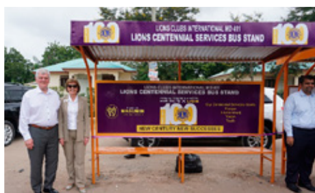
Strætóskýli sem verndar gegn brennandi sólinni; aldarafmælisverkefni Lions í Suður Afríku.