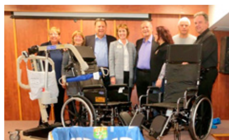
Hjólástólar og sjúkralyfta á heimili fyrir aldraða í Ísrael.