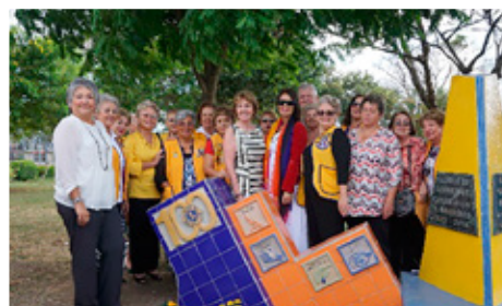
Aldarafmælisgarður í Guatemala.