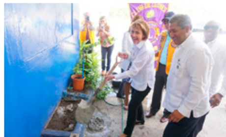
Lagður Grunnur að nýjum íþróttavelli við Skóla í Costa Rica.