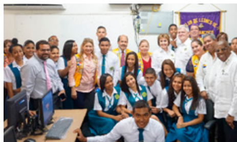
Tölvuver sem Lions í Panama gáfu í grunnskóla.

Eitt af skyldustörfum alþjóðaforseta er að skoða og taka þátt í Lionsverkefni, vígja eða opna ýmis stærri verkefni, eða leggja grunn að nýjum. Mikilvæg á þessu ári eru sérstök aldarafmælisverkefni, sem eru gjarnan tengd náttúru og heilbrigðum lífsstíl, svo sem almenningsgarðar, barnaleikvöllir, göngustígar. Hér eru nokkur dæmi frá síðustu heimsóknunum: