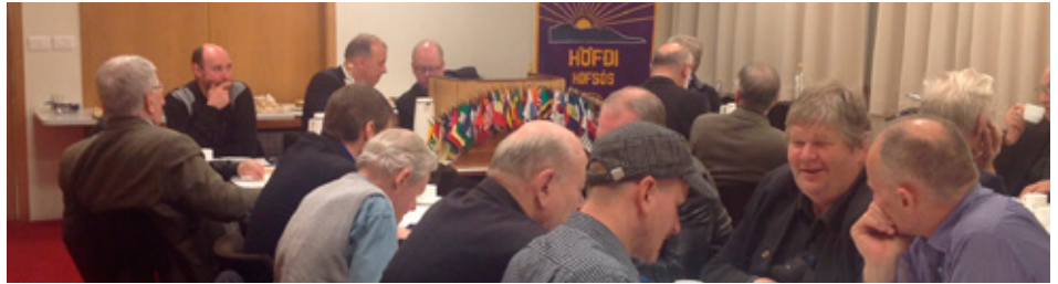
Heimsókn á Hofsó.