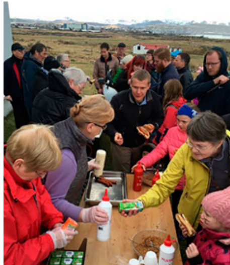
Grillveisla við Garðaholt.