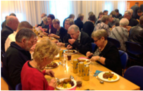
Árshátíð með Sunnukonum.