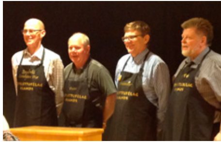
Félagar í Kótiletufélagi Íslands.