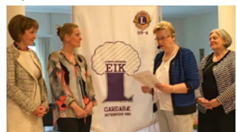
Inntaka nýs féлага.