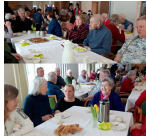
Pönnukökuveisla í Ísafold.