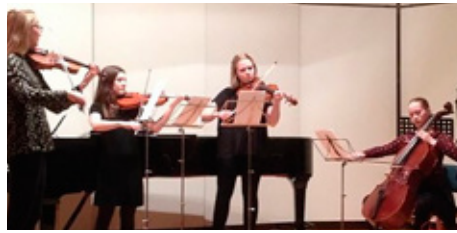
Strengjakvartett á jólafundi.