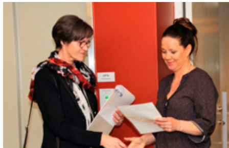
Guðmunda formaður Lkl. Emblu afhendir gjafabréf fyrir jafnvægstækini á Grensásdeild Landsspítalans.