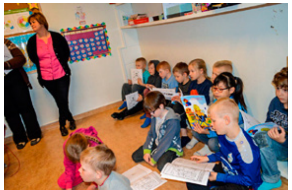
Krakkar 2. bekkjar skoða litabækurnar.