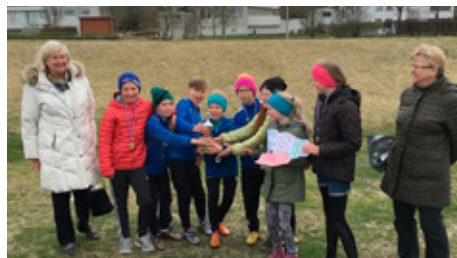
Vímuvarnahlaup – Verðlaunaafhending vinningsliðs Hofstaðaskóla.