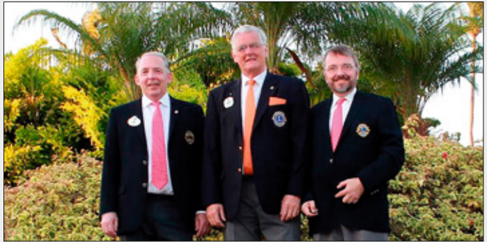
Fjölumðæmisstjóri ásamt umdæmisstjórum.