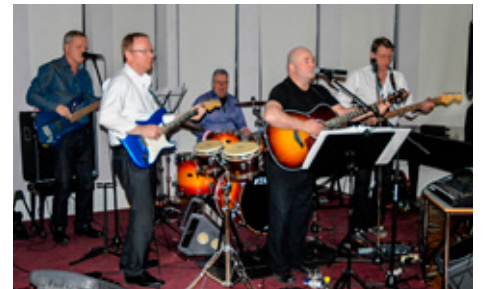
Hljómsveitin Halógen rokkaði fram á nótt.