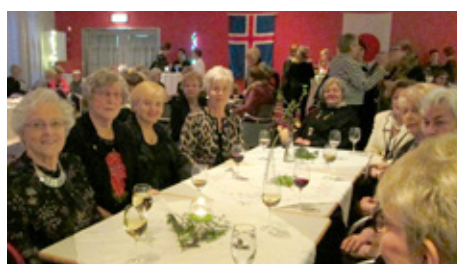
Eikarkonur í Haukahúsi.