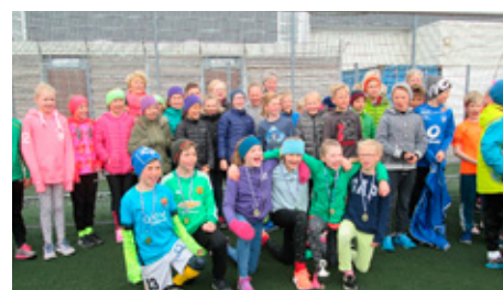
Vímuvarnahlaup – Vinningslið Flataskóla með bikarinn.