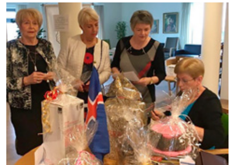
Happdrættisvinnningar í forgrunni á lokafundi.