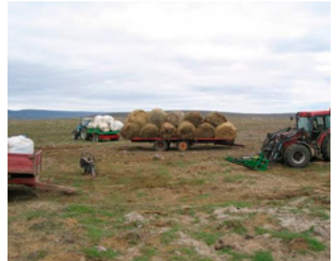
Heyrúllur bíða dreifingar. Tekin 21.6.2010.