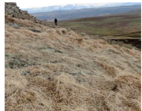
Mikið um að vera á Goddalafalli.