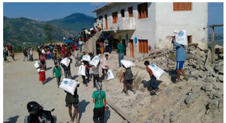
Þorpsbúar bera hjálpargögn frá Lions heim til sín.

svæðunum. Oft á tíðum fluttu þessar þyrlur illa slasað fólk til baka svo það kæmist undir læknishendur.