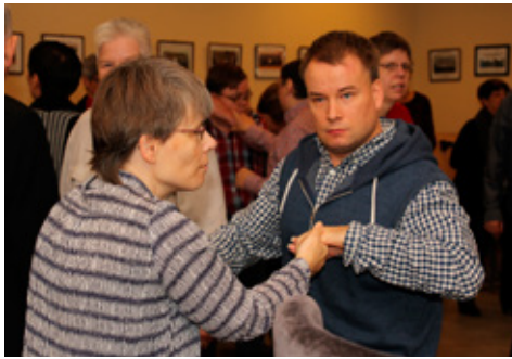
Dansað af hjartans list á Emblu diskóteki 24. okt. 2015.