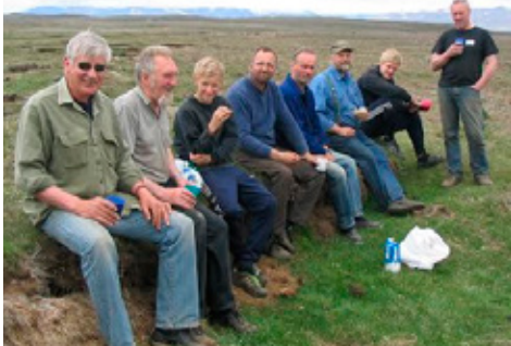
Stund milli stríða. Kampakátir Lionsmenn. Tekin 21.6.2010.