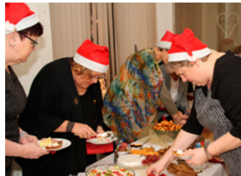
Jólafundinn okkur köllum við Hungurfund og þá er borðaður góður matur.