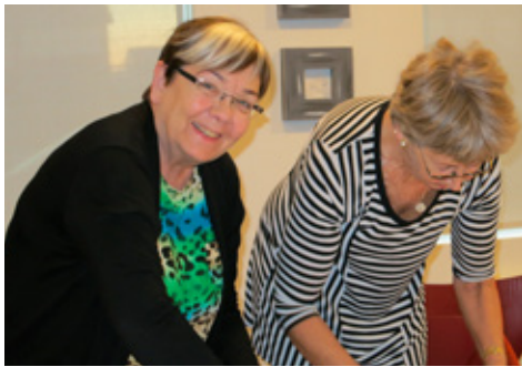
Svo þarf að telja kortin og þessar tær tók það að sér, og eru nokkuð kátar með það hlutverk.