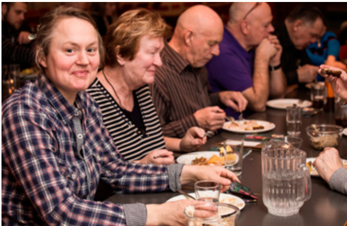
Á Þorláksmessu stóð klúbburinn fyrir skötu- og saltfisksveislu og mættu í hana um hundrað manns.

Í tengslum við jólamarkað sem haldinn var á Laugarvatni fyrsta ísunnudag í aðventu stóð klúbburinn fyrir blóðsykursmælingu hjá þeim sem það vildu. Einnig seldi klúbburinn flotkertir sem fleytt var á vatninu eftir að kveikt var jólatréi sem klúbburinn sér um ljósina á.