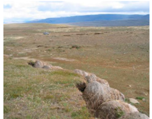
Hér sést hvað við er að eiga.