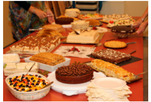
Svo var endað á kaffihlaðborði eftir að dansi lauk og allir fóru ánægðir heim.