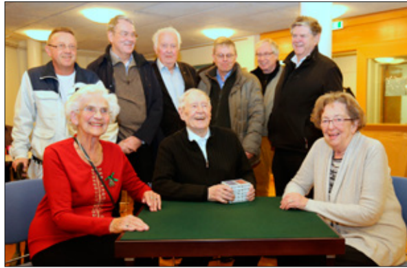
Eitt af spilaborðunum.