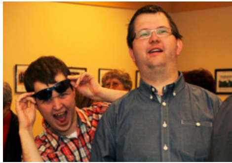
Það eru allir svo kátir og skemmta sér konunglega á þessum diskótekum.