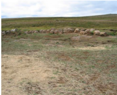
Búið að dreifa úr heyi á grýtta jörð. Tekin 30.9.2014.