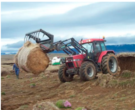
Rúllurnar komnar á sinn stað.