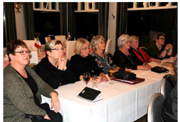
Emblukonur í Grímsborgum.