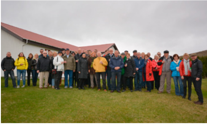
Vorferð í Borgarfjörð árið 2014.

þeim. Málverkaupborð voru fastur liður um tíma og þá var oft spurning hvernig ætti að sannfæra makann um gæði keyptrra verka við heimkomuna!