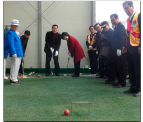
Kórea: Eldri borgarar keppa í krocket. Lionsfélagar gáfu verðlaunafé til sigurvegaranna í keppninni sem gaf af sér 6.500 dollara. Peningarnir runnu allir til góðgerðaverkefna klúbbsins.