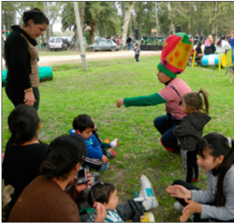
Argentína: Lionsfélagar að leika við ung börn á Degi barnsins. Félagarnir færðu börnunum, skó, leikföng og skólavörur.

Lionshreyfingin starfar í 210 löndum og landsvæðum. Klúbbarnir hjálpa fólki og bæta samfélög þess á ótal vegu. Þrátt fyrir mismunandi menningu og siði er tungumál Lions alstaðar hið sama; þjónusta.