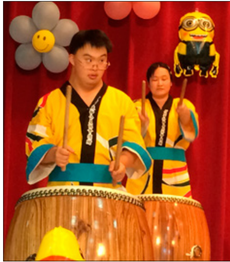
Taiwan: Lionsfélagar bjóða upp á tónlistarstarf fyrir fátæk börn.