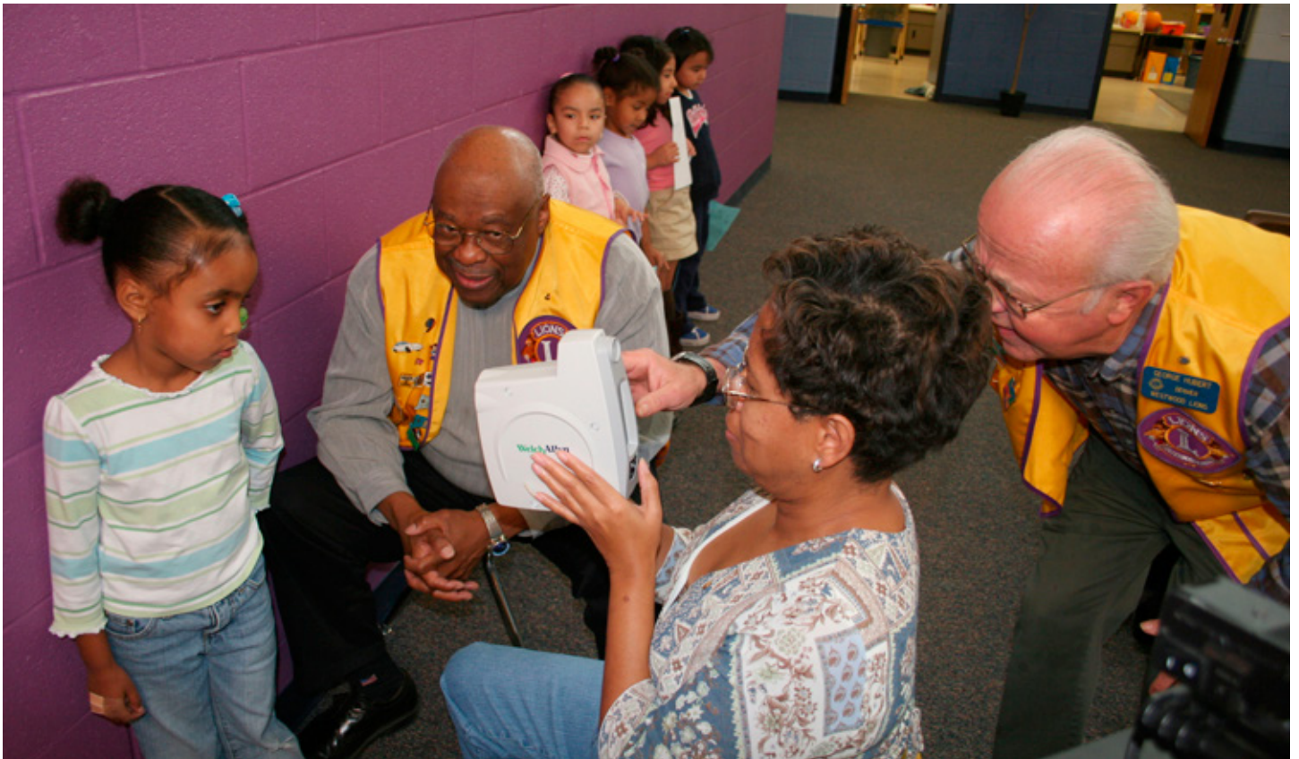
Lionsklúbbar um öll Bandaríkin taka þátt í að aðstoða við sjónmælingar barna.