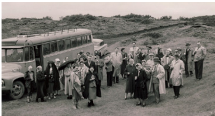
Afmæliserfð 14. ágúst, 1955. Hér er að við Bolabás á Þingvöllum.

Vorferðir klúbbsins hafa alltaf verið vinsælar. Það er gaman að