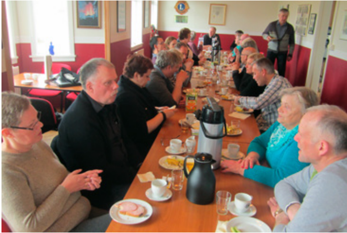
Morgunverður í Arnardröngum hjá Lionsmönnum í Eyjum.