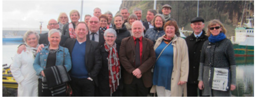
Hópmýnd, höfnin í Eyjum.