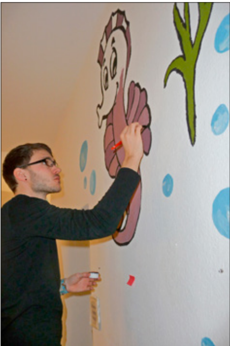
Þýskaland: Þýskir Lionsfélagar taka til hendi í sumarþúðum barna.