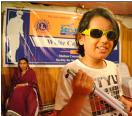
Pakistan: Blind stúlka með blindrastaf sem Lionsfélagar færðu henni að gjöf.