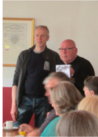
Formenn klúbbanna standa saman.