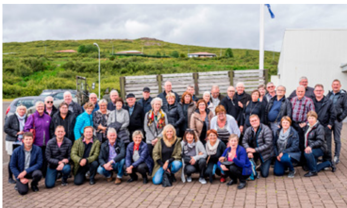
Þessi hópmýnd er tekin við Stríðsminjasafnið í Hvalfirði.

Allt var þetta gert með glæsilegum hætti og bros á öllum andlitum. Á sunnudeginum var ekið heim á leið en staldrað við í Stríðsminjasafninu í Hvalfirði.