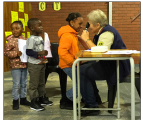
Suður-Afríka: Lionsfélagar standa fyrir augnskimun skólabarna.