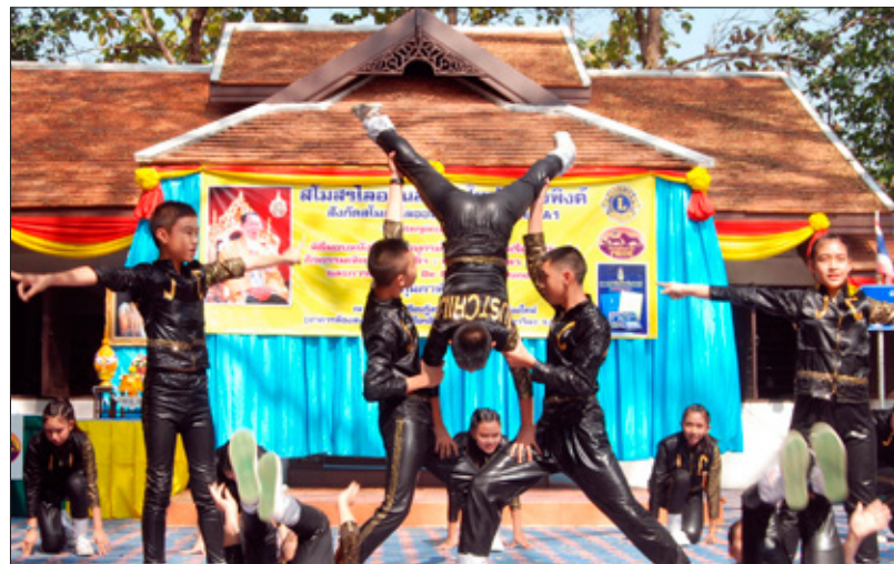
Tailand: Dansleikur fyrir ungt fólk skipulagður af Lionsfélögum til styrktar baráttunni gegn eituryfjaneyslu.