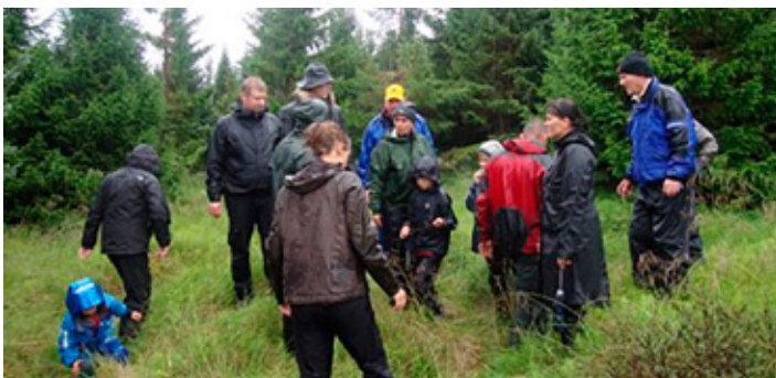
Það er ekki alltaf sólskin í skógræktinni! Árleg gróðursetningarferð að Gumfríðarstöðum í Blöndudal en þar hefur klúbburinn skógarreit.