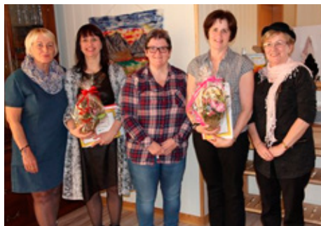
Tveir nýjir félagar teknir inn á lokafundi.