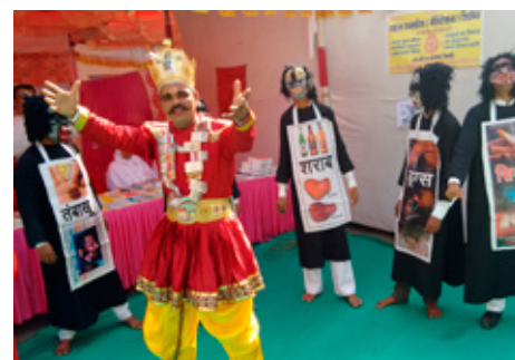
Indland: Félagar í Lkl. Kaylan sýna skólabörnum á leikrænan hátt afleiðingar neyslu lyfja og áfengis.