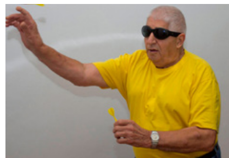
Króatía: Lkl. Vukovar stendur fyrir þlu-keppni fyrir blinda.