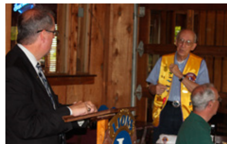
Frá fundinum í USA.

stöðuna. Fundinum lauk síðan með einhverskonar látbragsleik sem minnti á urrandi ljón! Í byrjun fundarins afhent ég þeim fána klúbbsins míns, einnig gaf ég þeim alþjóðapinna fjölumdæmisins og voru þeir fljótir að setja hann í stórfánann.