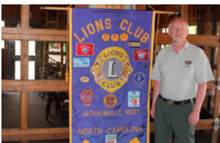
Skýrir sig sjálf.