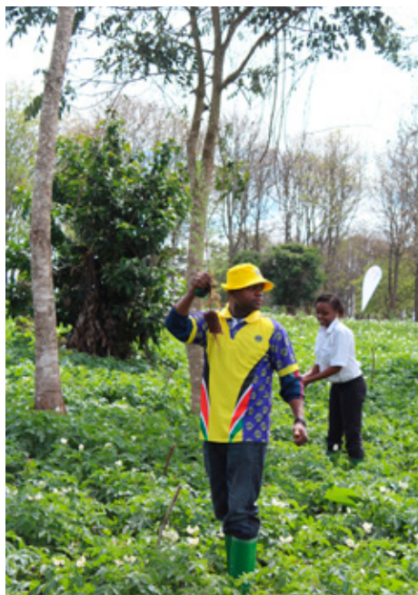
Kenýja: Lionsfélagi gróðursetur eitt af þeim 11.000 trjám sem sett voru niður á einum degi. Árið 2018 munu Lionsfélagar ásamt samherjum hafa gróðursett 15 milljónir trjáa í Kenýa.