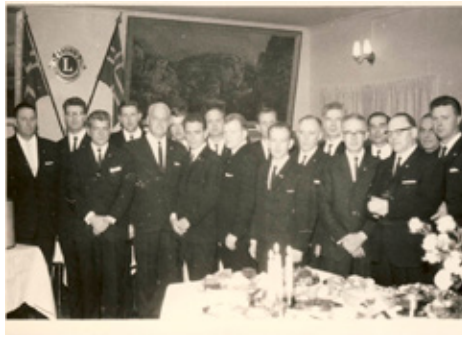
Frá stofnskrárfundi Lionklúbb Selfoss.