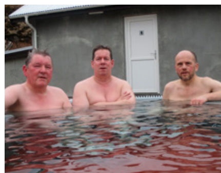
Heilsubót í pottinum.