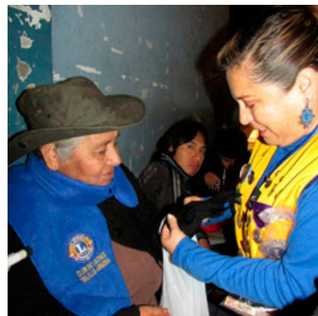
Perú: Félagar í Lkl. Trujillo Armonia útdeila treflum og vettlingum til aldraðra.