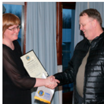
Ingunn formaður þakkar fyrir.