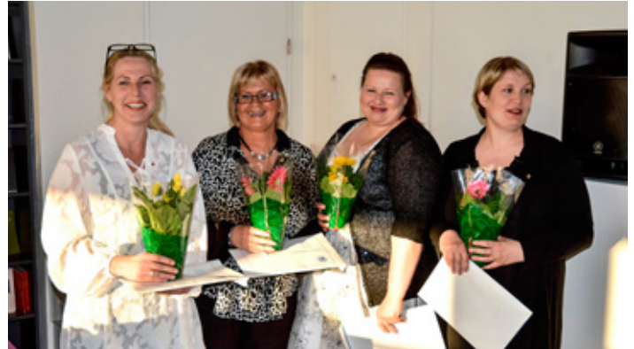
Nokkrir nýjir félagar sem gengu í klúbbinn..