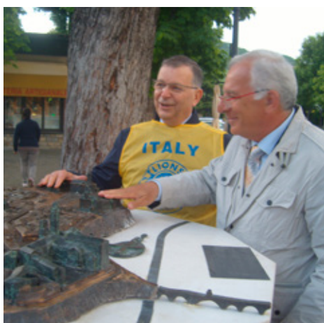
Ítalía: Félagar í Lkl. Certosa di Pavia dást að blindasýningu sem klúbburinn stóð fyrir.