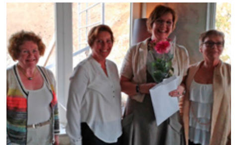
Nýr félagi tekinn í klúbbinn.