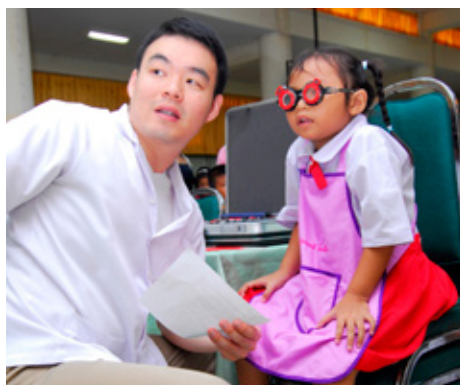
Thailand: Barn fær augnskoðun í gegnum verkefni LCIF Sjón fyrir börnin.