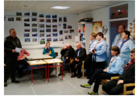
Frá afhendingu gjafa til Fossbúa.

Þann 13. apríl 1965 var Lionsklúbbur Selfoss stofnaður er hann því 50 ára í ár. Stofnfélagar voru 15 en nú eru félagar 33, þar af einn stofnfélagi. Klúbburinn hefur ávallt verið öflugur og frjór, hann hefur alltaf haft líknar-, menningar- og umhverfismál að leiðarljósi í sínu starfi og einkum sinnt slíkum verkefnum í nærumhverfinu, en klúbburinn hefur einnig stutt verkefni bæði á landsvísi og á alþjóðavettvangi. Aðalfjáröflun líknar- og menningarsjóðs klúbbsins hefur verið útgáfa á Jólblaði Lions sem klúbburinn hefur gefið út í 32 ár. Í blaðinu er fróðleikur og greinar eftir lionsfélaga ásamt jólakveðjum frá fyrirtækjum í Árborg og nágrenni. eru þeim færðar bestu þakkir fyrir stuðninginn.