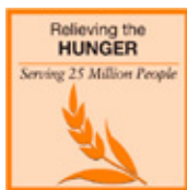
Að draga úr hungri

Markmiðið er að leggja lið eitt hundrað milljón manns, 25 milljón í hverjum flokki. Á Íslandi gætum við miðað við að leggja lið 200.000 manns, í hverjum flokki um 50.000 manns.