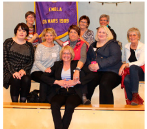
Það þótti mörgum langt að sækja þing til Seyðisfjarðar, en Emblukonur töldu það ekki eftir sér, þær voru 9 mættar á þingið