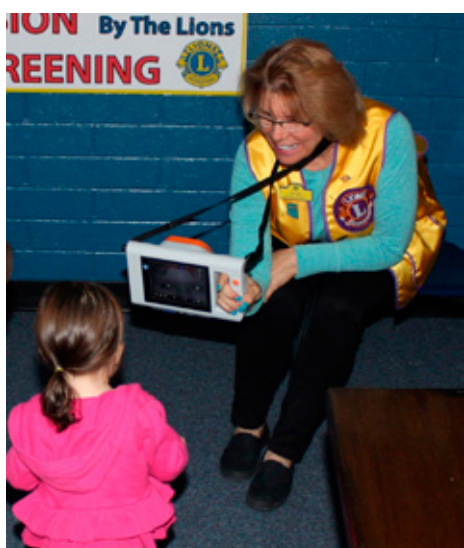
Arizona: Félagi úr Lkl. Tucson Downtown atugar barn með sérþarfir.