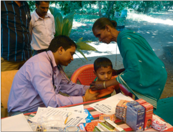
Ungur drengur fær læknishjálp á Nirman heilsugæslunni í Mumbai sem Lionsklúbburinn Versova sem á og rekur.

Mumbai, hin glæsilega höfuðborg Maharashtra, er ríkasta borg Indlands. Með sína 18,4 milljónir íbúa er borgin heimili fleiri milljónera og billjónera en nokkur önnur borg landsins. Samt þjáist þessi stórborg af örþingd, gríðarlegu atvinnuleysi og heilbrigðisþjónusta er í lamasessi að minnsta kosti fyrir þá sem mest þurfa á henni að halda.