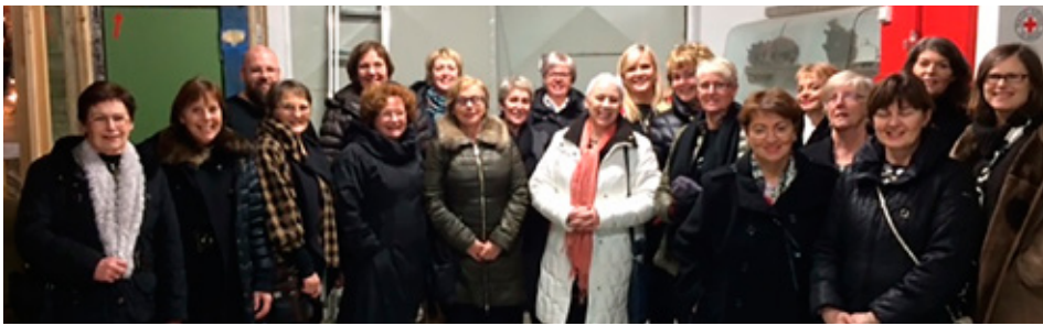
Í Íshúsi Hafnarfjarðar.