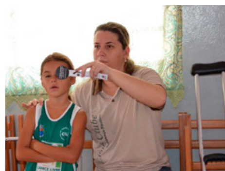
Brasilía: Lionsfélagi kannar sjónina hjá ungu barni.