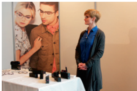
Gleraugnaverslunin Augað í samvinnu við gleraugnaframleiðandann Reykjavík Eyes kynnti það nýjasta í gleraugnaumgjörðum.