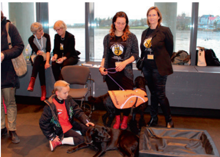
Þjónustu- og þekkingarmiðstöðin kynnti ýmis hjálpartæki sem blindir og sjónskertir nota í sínu daglega lífi. Einnig voru með þeim í för leiðsöguhundar fyrir blinda, þau Bono og Asita. En Lions á Íslandi, í samvinnu við Blindrafélagið, stóð einmitt fyrir söfnun til kaupa á leiðsöguhundum með Rauðu fjöðrinni árið 2008, og mun endurtaka þann leik vorið 2015.