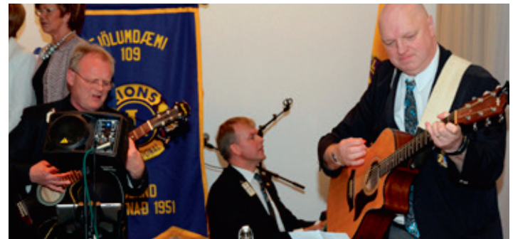
Sönghópur Lionsfélaga og hljómsveit.