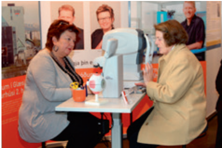
Hjúkrunarfræðingur frá augnlæknastofunni Augljós að störfum með gesti á sýningunni.

Fjöldi fagaðila á sviði sjónverndar kom að sýningunni og kynnti starfsemi sína. Boðið var upp á fræðslu um augnsjúkdóma og augnlækningar og kynntar ýmsar vörur tengdar augnheilsu. Sjónmælingar og augnmælingar ýmis konar vöktu mikla lukku meðal gesta og gangandi og var stöðug biðröð í þær mælingar meðan á sýningunni stóð.