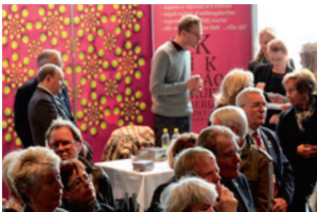
Félag sjóntækjafræðinga kynnti störf sjóntækjafræðinga.