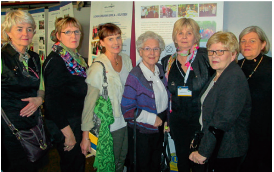
Eikarkonr á sýningunni í Ráðhúsi Reykjavíkur.