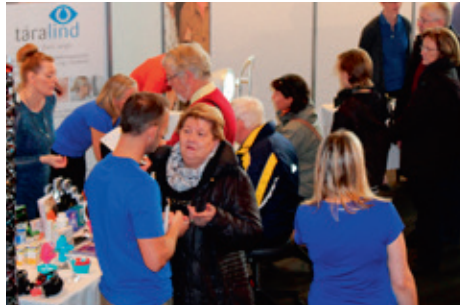
Augnlæknastöðin Sjónlag, ásamt Eyesland og Táralind kynnti heilstæða þjónustu og bauð upp á mælingar meðan á sýningu stóð.