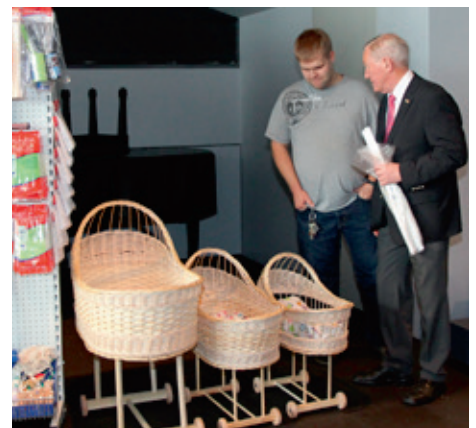
Blindravinnustofan kynnti framleiðsluvöru sína, þar á meðal hinar klassísku tágavöggur.