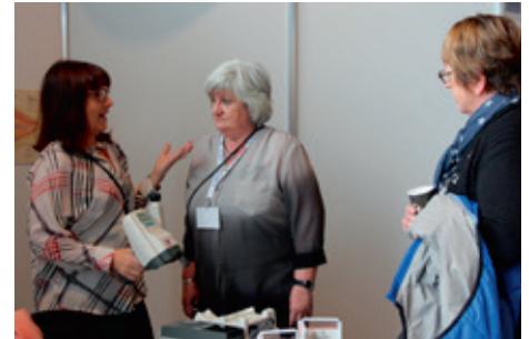
Augnlæknafélag Íslands átti sinn fulltrúa á sýningunni sem bauð upp á mælingar.