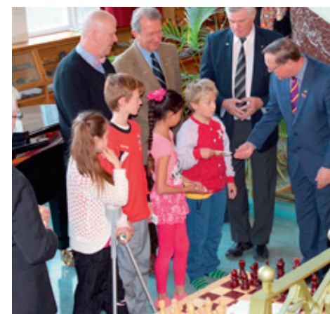
Fulltrúar 6 bekkjar Laugarnesskóla fá afhent bókamerki.