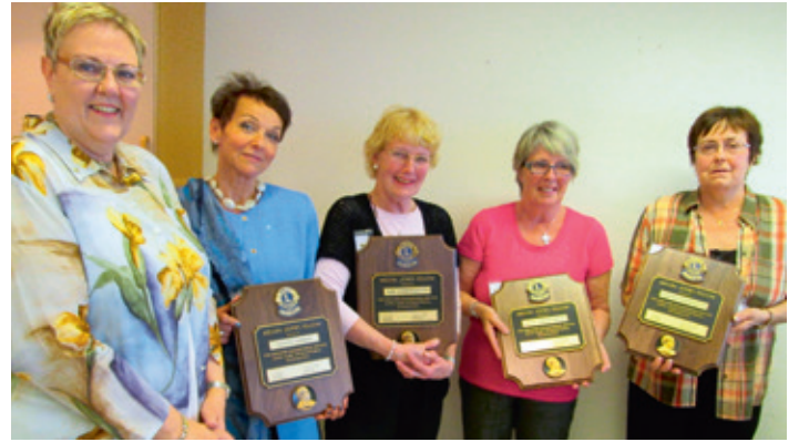
Melvin Jones – félagar.