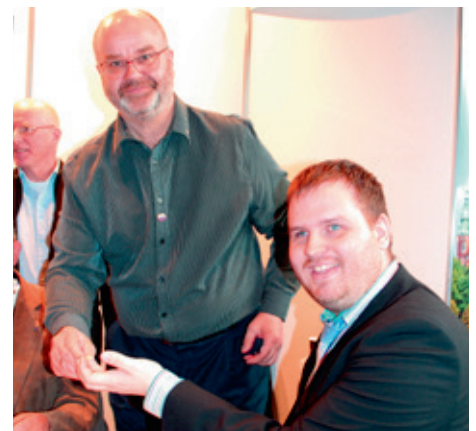
Lkl. Kópavogs bauð upp á blóðsykurmælingar meðan á sýningunni stóð.