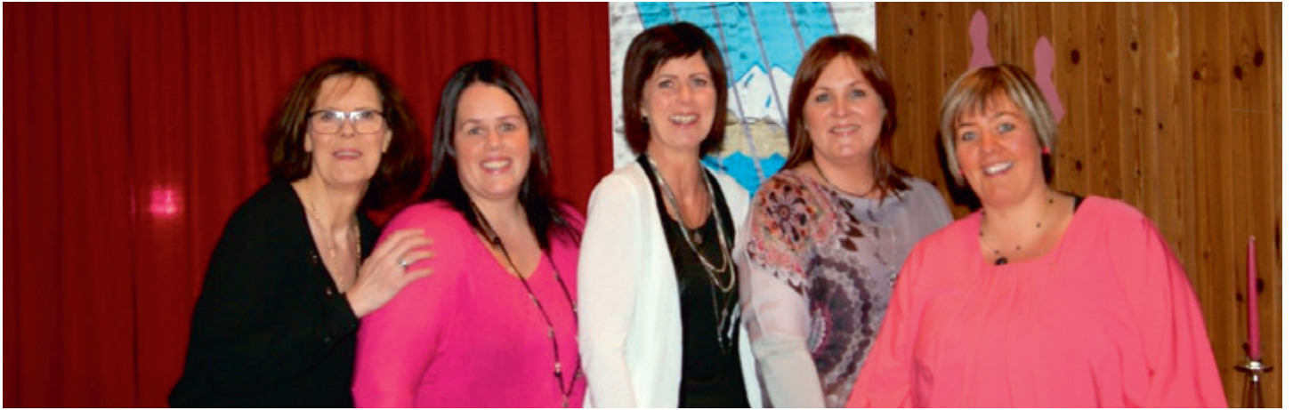
Skemmtinefnd Ránar dekkudu borð, elduðu mat og voru með skemmtiatriði, snillingar þessar.