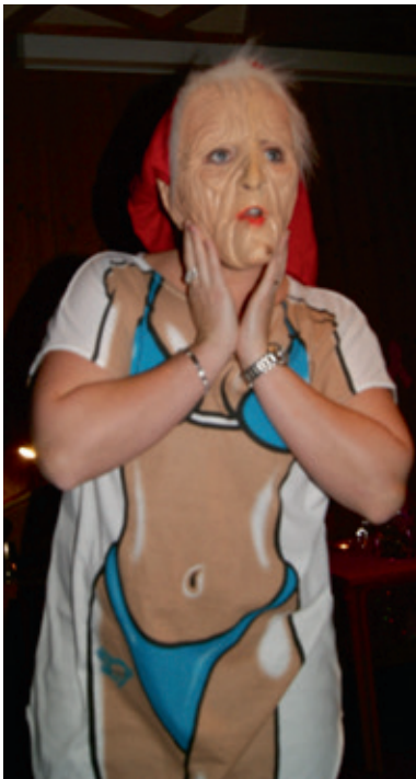
Þernukona alveg með 'etta, eða þannig.

Sú hefð hefur skapast meðal kvemnaklúbbanna á Snæfellsnesi, Ránar í Ólafsvík, Hörpunnar í Stykkishólmi og Þernunnar á Hellissandi að hittast á samfundi á hverju hausti.