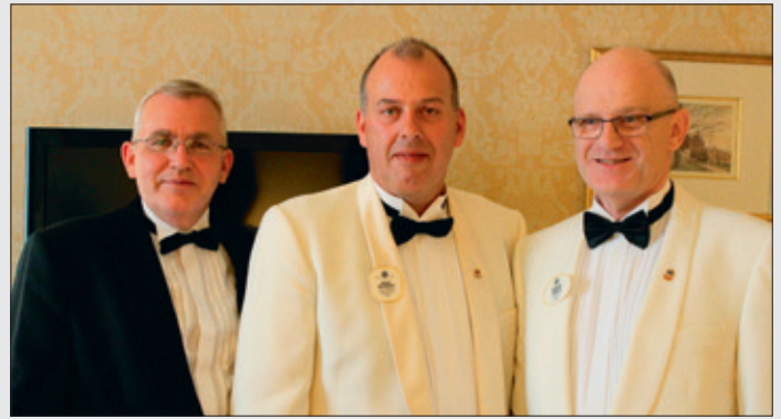
Fjöllumdæmisstjóri ásamt umdæmisstjórum.