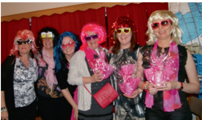
Keppnislíð úr öllum klúbbum.