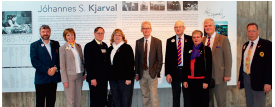
Einnig skoðuðu þau Hörpu, en hjónin eru mjög áhugasöm um tónlist og myndlist.