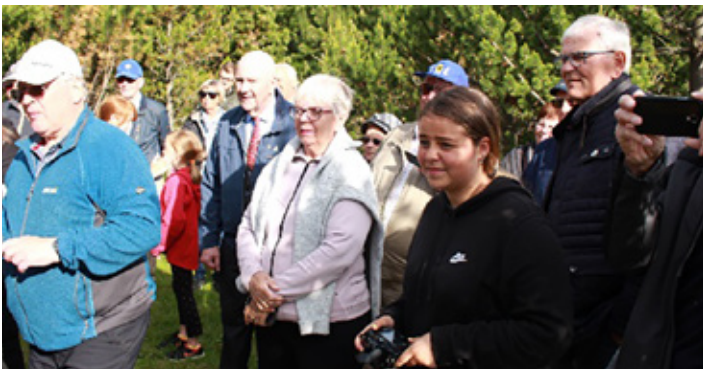
Tekið á móti Alþjóðaforseta