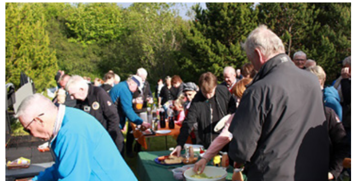
Lions félagar og gestir. Tekið var vel til matar