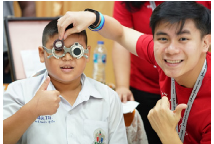
Sight for Kids, Lionsfélagi mælir sjón í barni í Taílandi.