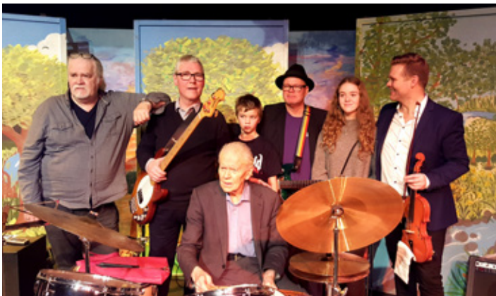
Litlu jólin að Sólheimum