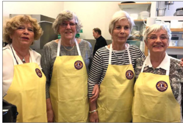
Eikarkonur bjóða upp á súpu í Vídalínskirkju