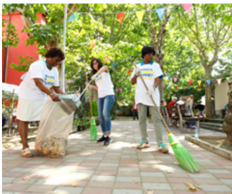
Lions leggur lið – þessir ráðstefnugestir sýna það í verki er þeir gefa sér tíma fyrir tiltekt í almenningsgarði.