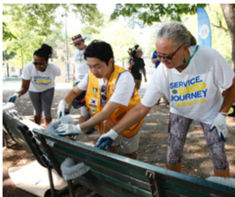
Lions leggur lið – þessir ráðstefnugestir sýna það í verki er þeir gefa sér tíma fyrir tiltekt í almenningsgarði.