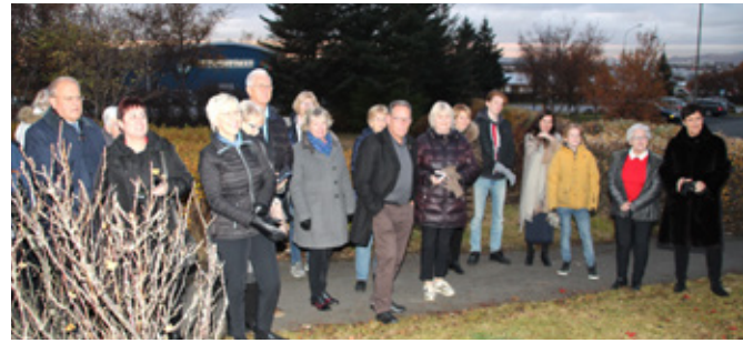
Lionsfélagar fylgjast með opnuninni