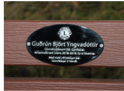
Merkingin á bekknum