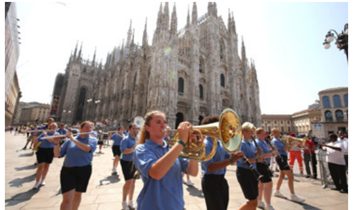
Lúðrasveit æskufólks leiðir skrúðgöngu með hina fögru dómkirkju Mílanó í baksýn.