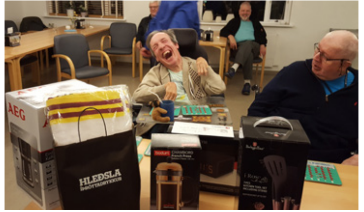
Spilum bingo árlega hjá Sjálfsbjörgu að Hátúni 12, Róvk.