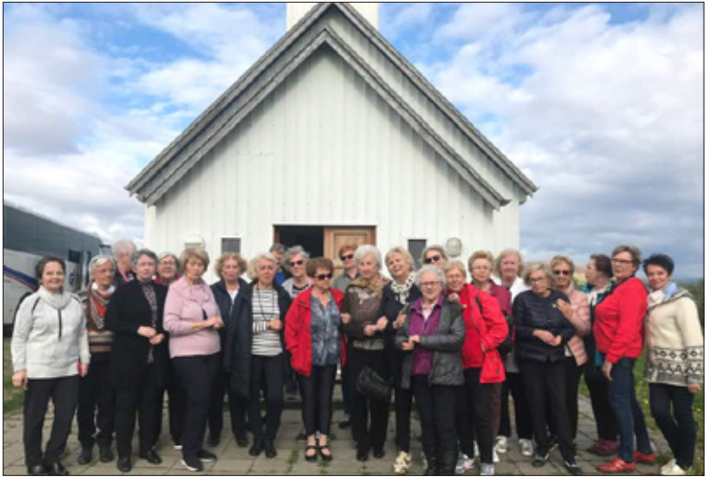
Eikarfélagar í vorferð