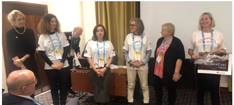
Nokkrar konur sem tóku þátt í verkefninu

Á kynningu sem var haldin um ýmis verkefni í Afríku kynntist ég verkefnum sem kölluð eru WaSH (Water, Sanitation and