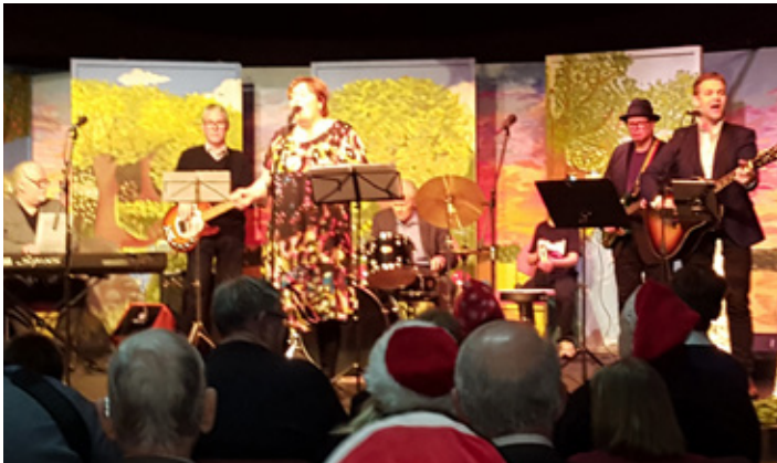
Litlu jólin að Sólheimum