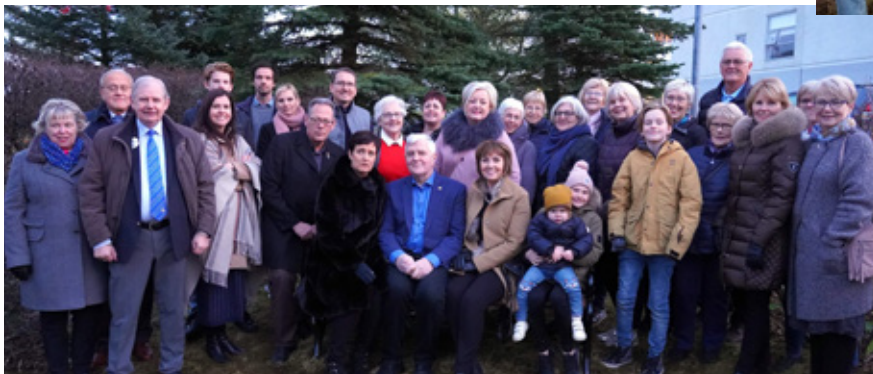
Höfmynd af gestum