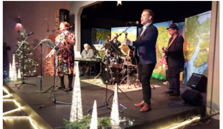
Litlu jólin að Sólheimum