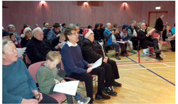
Litlu jólin að Sólheimum