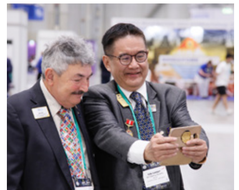
Á ráðstefnum verður selfie oftar en ekki að hóp-selfie.