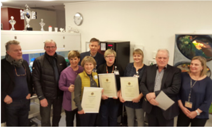
Stórgjafir afhentar á Grensásdeild að verðmæti 16 milljónir