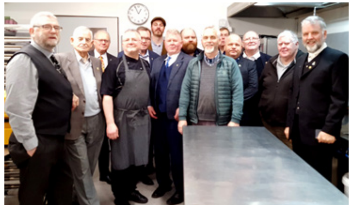
Gáfum Sólheimum nýtt eldhús