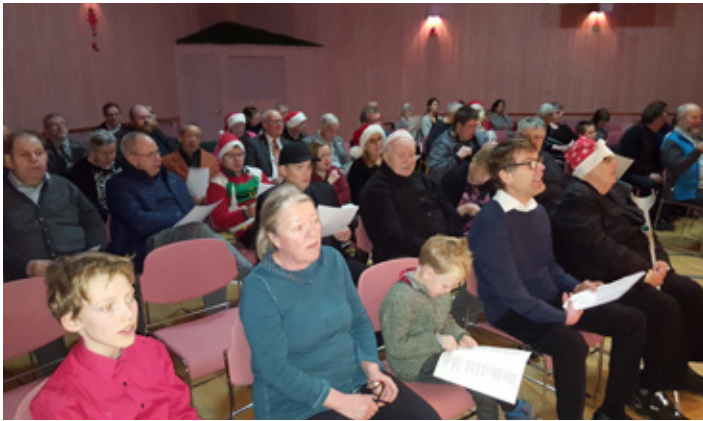
Litlu jólin að Sólheimum – sem klúbburinn hefur gert í fast nær 60 ár