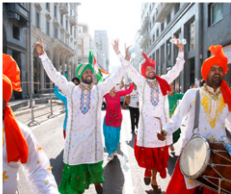
Þjóðaskrúðgangan sýnir vel ótrúlega fjölbreytni Lions um heim allan.