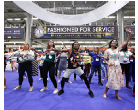
Á ráðstefnum veit maður aldrei hvenær þátttakendur bresta í dans.