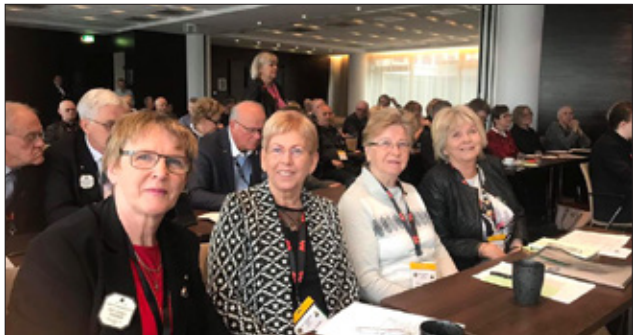
Eikarfulltrúar á Lionsþingi