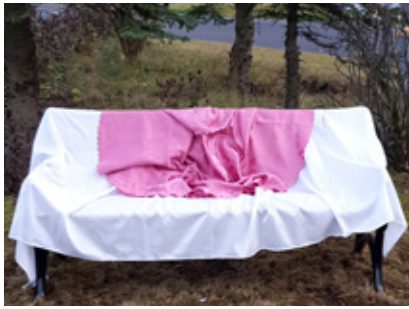
Bekkurinn góði hjúpaður