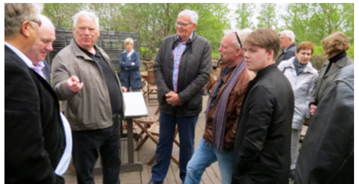
Klúbbfélagar á góðum vordegi.