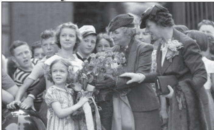
Helen Keller heilsar fólki á leið til Lions-þings 1925.