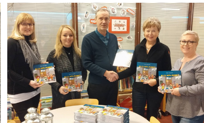
Ein af þeim gjöfum sem klúbburinn hefur gefið Álftanesskóla var bókin Viltu vera memm sem fjallar um einelti.

Markmið þessara verkefna er annars vegar að láta gott af sér leiða í nærumhverfi og samfélagi, en um leið að afla fjár í líknarsjóð sem nýttur er til fleiri góðra verka. Klúbburinn hefur styrkt ýmis verkefni á vegum Lions á landsvísu og erlendis, gefið gjafir m.a. til ungmennastarfs ýmis konar á Álftanesi, auk þess að leggja lið í gegnum aðra sjóði, svo sem Líknarsjóð Álftaness og Alþjóðahjálparsjóð Lions.