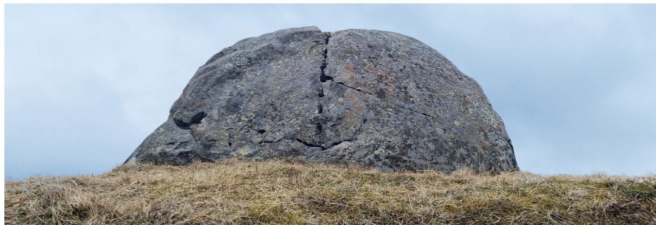
Grásteinn. Á steininum eru fjar sem sýna að reynt hefur verið að færa hann úr stað eða brjóta hann niður.

Á síðustu öld, fram yfir stríð, var Álftanes landbúnaðarhérað þar sem reynt var að ræsa fram mýrar, rækta gras og framleiða mjólk og kjöt. Ræktunin tókst ekki sem skyldi og landbúnaðinum hnignaði smám saman þegar leið á öldina (1960). Fólki fækkaði á nesinu og voru íbúar aðeins 117 árið 1940 en fór síðan fjölgandi þegar eftirspurn eftir landspildum og byggingarlóðum hófst. Núverandi þróun, þéttbýlismyndunin, hófst þó ekki að marki fyrr en upp úr 1970 þegar ákveðið var að hér yrði ekki byggður flugvöllur, en hann hafði þá verið á teikniborðum í um 10 ára skeið.