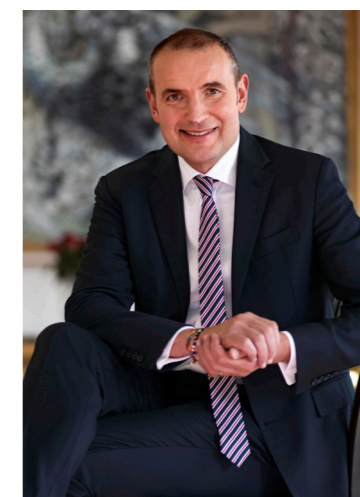
Guðni Th. Jóhannesson

Ég býð alla gesti á landsþingi Lions hjartanlega velkomna til fundar á Álftanesi. Ég veit að sveitungar mínir munu taka vel á móti þingfulltrúum og óska ykkur öllum velfarnaðar í ykkar mikilvæga atbeina, landi og þjóð til heilla. Í þeim efnum hlakka ég ekki síst til þess að sjá hvernig samtakamáttur ykkar getur nýst til að styðja við rannsóknir á sviði lýðheilsu og læknávisinda en nýtt verkefni Lionshreyfingarinnar, sem kynnt er í þessu blaði og snýr að sjálfsöfnæmi, er áhugaverð viðbót við fyrri flóru. Þar er alltaf verk að vinna og þar hefur Lionshreyfingin svo sannarlega skipt sköpum í tímans rás.