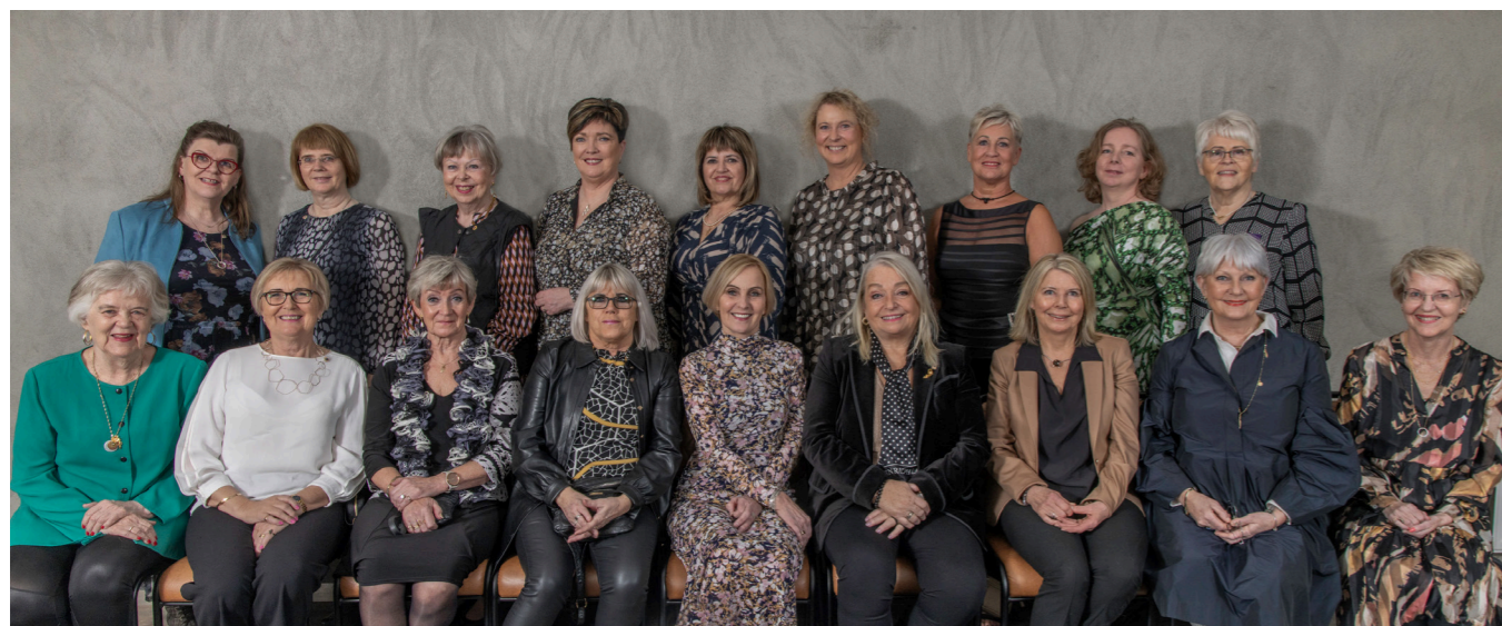
10 ára afmælisfundur klúbbsins var haldinn í veislusal Braggans í Nauthólsvík. Þessi mynd var tekin við það tilefni.

Lionsklúbburinn Seyla var stofnaður á Álftanesi árið 2012. Klúbburinn samanstendur nú af 22 konum sem ýmist búa eða hafa búið á Álftanesi. Eitt af markmiðum Lions hreyfingarinnar er „að tengja félagana böndum vináttu, góðs félagsanda og gagnkvæms skilnings“. Þetta markmið hefur verið leiðarljós klúbbsins, ekki síst á félagsfundum, enda er góður félagsandi forsenda góðra verka. Klúbburinn fundar einu sinni í mánuði, annan fimmtudag hvers mánaðar frá september fram í maí, í safnaðarheimili Bessastaðasóknar. Á hefðbundnum fundi er borðað saman, starf klúbbsins skipulagt og stundum er einhvers konar fróðleikur eða skemmtun á dagskrá. Af og til bregður klúbburinn svo undir sig betri fætinum og heldur fundi sína annars staðar.