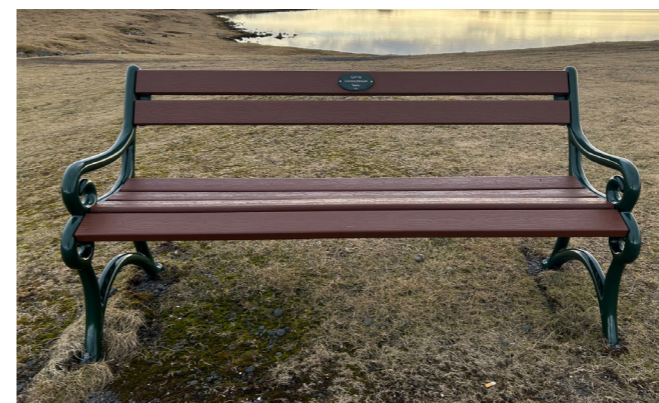
Á 10 ára afmæli klúbbsins gaf klúbburinn íbúum Álftaness bekk til að tylla sér í gönguferðum. Bekkurinn er staðsettur við kynningarskilti um gömlu höfnina við Seylu og Skansinn.

Klúbburinn hefur aflað fjár í líknarsjóð með ýmsum hætti. Árviss verkefni eru m.a. fjórhreinsun, en allt frá fyrsta starfsári hefur klúbburinn hreinsað strönd Lambhaga og Skógtjarnar. Síðustu tíu ár hefur klúbburinn einnig staðið fyrir kvennagolfmóti á Álftanesgolfvelli sem fram fer í byrjun sumars og fyrir jólin hefur klúbburinn bakað sögur í stórum stíl og selt Álfnesingum og nærsveitungum. Nýju fjáröflunarverkefni var svo hleypt af stokkunum í vor sem var loppumarkaður sem haldinn var á Garðatorgi.